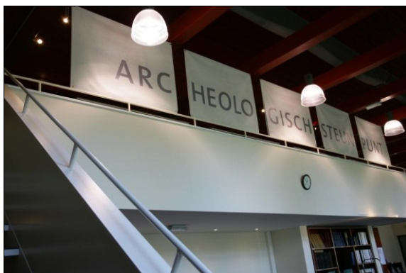
De tentoonstellingsruimte boven de leeszaal