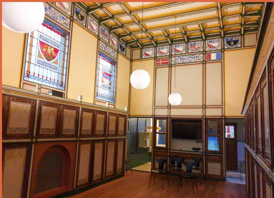
Moderne variant van het cassettenplafond in het pand van De Utrecht, Tweebakmarkt 48 in Leeuwarden

en de 'juiste' verhoudingen mee, zoals die van de Gulden Snede of de duoi quadri in lunghezza . De architecten introduceerden een integrale ontwerpvisie op het interieur, waarbij een harmonieuze eenheid werd nagestreefd. Naar Frans voorbeeld werden de decoraties van wanden, plafond, schoorsteen en meubels op elkaar afgestemd. Met name in de hofkringen werd het Franse voorbeeld op de voet gevolgd. De overname van een zorgvuldige hiërarchische structurering van de vertrekken, het zogenaamde appartementensysteem, paste naadloos binnen het ontvangstritueel van de Europese vorstenhuizen. De gewone 17e-eeuwse burger hield er, ondanks het gestegen welvaartsniveau in de Gouden Eeuw, een opvallend sobere leefstijl op na.