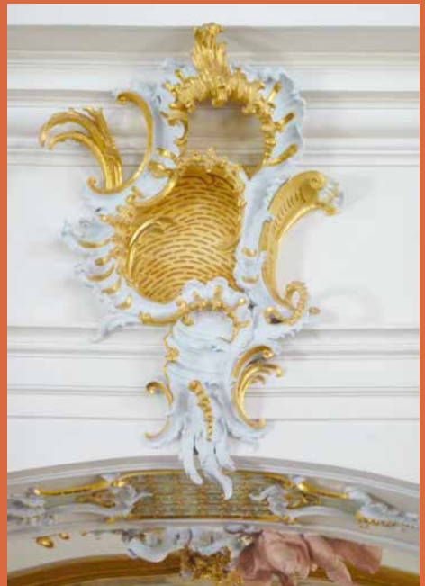
Rocaille schelpmotief, kenmerkend voor de Lodewijk XV-stijl

deze stijl zich door zijn elegante vormtaal en speelse decoraties. Opmerkelijk is dat de Lodewijk XV-stijl zich het meest manifesteert in interieurs, waarbij het stucwerkplafond als een cruciaal onderdeel werd gezien. Wand en plafonds werden bij voorkeur als een geheel ontworpen. Kenmerkend is het zwierige en asymmetrische lijnenspel van de plafondlijsten, vaak beëindigd in C- en S-krullen. Een veel gezien ornament is de rocaille, een asymmetrisch schelpmotief. De inbreng van hofarchitect Pieter de Swart was van groot belang voor de ontwikkeling van de stijl. Hij ontwierp in 1760 het interieur voor de raadzaal van Leeuwarden. De decoratie van de wanden en het plafond zijn karakteristiek voor de Lodewijk XV-stijl. Een mooi voorbeeld van een Lodewijk XV stucplafond in een Leeuwarder woonhuis is te vinden in het pand Voorstreek 84.