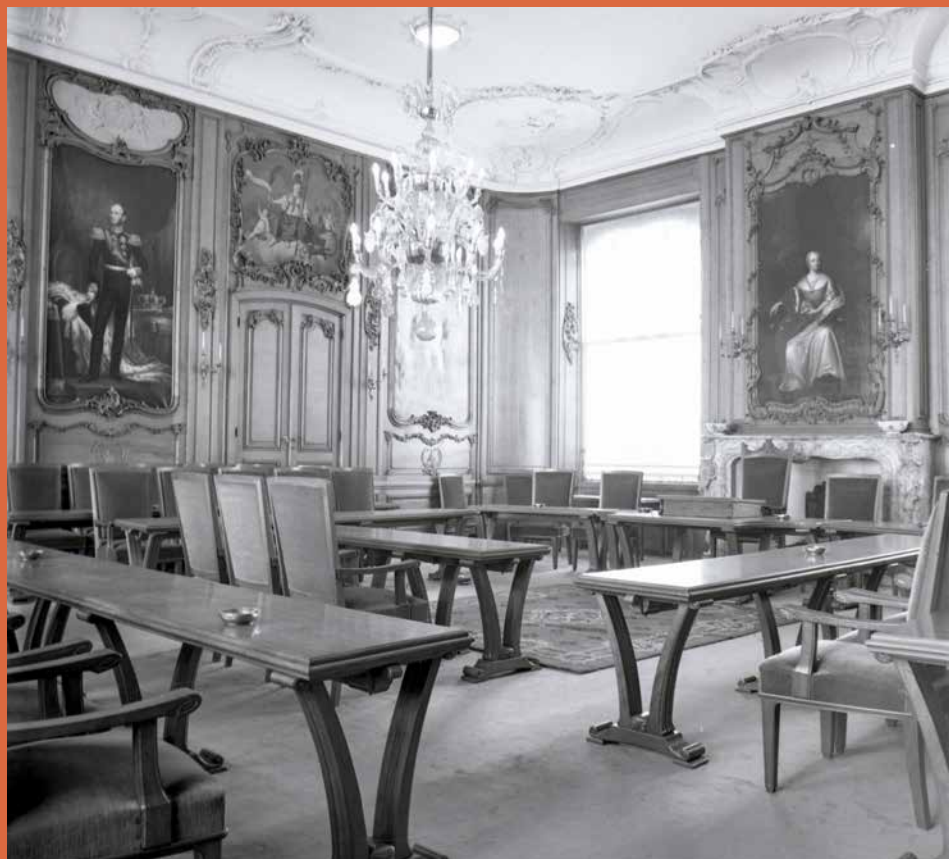
Raadzaal van Leeuwarden in Lodewijk XV-stijl

Geheel anders van vorm is de Lodewijk XVI-stijl, vanaf het laatste kwart van de 18e eeuw. Deze stijl is te typeren als elegant, maar strakker van vorm dan de voorgaande Lodewijkstijlen. Opnieuw bloeide de interesse voor de Klassieke Oudheid op, die de inspiratie leverde voor motieven als pilasters, frontons, vazen en festoenen. Door de opgravingen in Herculaneum en Pompeï werden daar rond 1800 motieven als lauwerkransen, medaillons en guirlandes aan toegevoegd. De Egyptische veldtocht van Napoleon bracht de inspiratie voor de toevoeging van oud-Egyptische motieven als papyruszuilen, sfinxen en palmetten, waaier- en amandelvormen. Dan wordt er ook wel van empirestijl