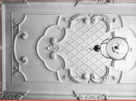
Treillage op een plafond in Lodewijk XIV-stijl

'zwaar' lijstwerk in vergelijking met lijstwerk van de latere Lodewijkstijlen. Het treillage (ruitmotief) en de symmetrische kuif zijn kenmerkende ornamenten voor de stijl. Voor wat betreft de plafonds waren de illusionistische plafonds (geschilderd op doek of planken) met wolkenluchten, zwevende putti, vogeltjes, goden en godinnen nog altijd zeer populair. De beschilderingen werden echter 'luchtiger' van sfeer dan hun 17e-eeuwse voorgangers. De grootste verandering was echter de grote populariteit van de stucwerkplafonds in stedelijke woonhuizen. Er ontstond in de eerste helft van de 18e eeuw een grote behoefte om het interieur met plastisch beeldhouwwerk te versieren en het relatief goedkope stucwerk maakte dit voor de rijkere burgerij mogelijk. Ook de witte kleur van de stucwerkplafonds werd gewaardeerd, omdat daarmee het daglicht werd gereflecteerd en zodoende dieper in de kleurrijke ruimtes kon binnendringen. Het witte stucwerk combineerde uitstekend met de beschilderde plafonds, waarbij dit kon fungeren als afkadering, al dan niet in combinatie met een gebogen koof als overgang naar de wanden.