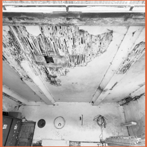
Stucplafond aangebracht op riet

Het decoreren van plafonds met stucwerk gaat reeds terug tot de 16e eeuw. Bij de vroege stucwerkdecoraties volgden deze als het ware de vorm van het balkenplafond, het zogenaamde Keulse plafond of Kölner Decke . Dergelijke vroege stucwerkplafonds zijn in ons land dan ook met name in de Duitse grensstreken aangetroffen. Een ander opmerkelijke ontwikkeling is die van de vroeg 17e-eeuwse stucwerkplafonds in Den Briel, die stilistisch sterk aansluiten bij de Engelse plafonds; een land waarmee het stadje nauwe handelsrelaties onderhield. Vanaf het derde kwart van de 17e eeuw werden de stucwerkdecoraties aangebracht door gespecialiseerde decorateurs, afkomstig uit Noord-Italië. Meestal werden deze plafonds aangebracht op een vlak verlaagd plafond onder de (enkelvoudige) balklaag. Het verlaagde plafond werd gemaakt door latten tegen de onderzijde van de balken te spijkeren, hier werden met koperdraad riet of twijgen aan bevestigd. Door de ruwe structuur kon hier de wat grovere basislaag (raaplaag) op aangebracht worden.