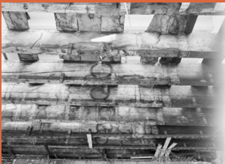
Balkenplafond in Huis Drakenburgh tijdens een restauratie in 1966

In de 17e eeuw kwam de architect als zelfstandig beroep op, waar eerder timmerlieden en steenhouwers de leiding hadden over de bouw. Gelijktijdig met de opkomst van het Hollandse classicisme in de jaren '20 van de 17e eeuw begonnen enkele kunstschilders uit Haarlem en Amsterdam zich te begeven op het gebied van de architectuur. Ze brachten hun kennis van de klassieke zuilenorden