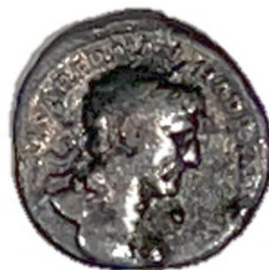
Romeinse munt met keizer Trajanus