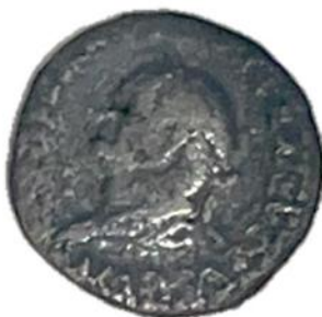
Romeinse munt met keizer Vespasianus