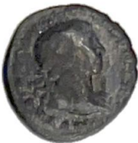
Romeinse munt met keizer Hadrianus

Hieronder zie je drie Romeinse munten die in Leeuwarden in de grond gevonden zijn. Op de munten staat telkens een keizer afgebeeld. Hierdoor weten we uit welke tijd de munt komt. Zoek op tussen welke jaren de keizers regeerden. Schrijf dit onder de munt. Omcirkel tot slot de oudste van de drie munten.