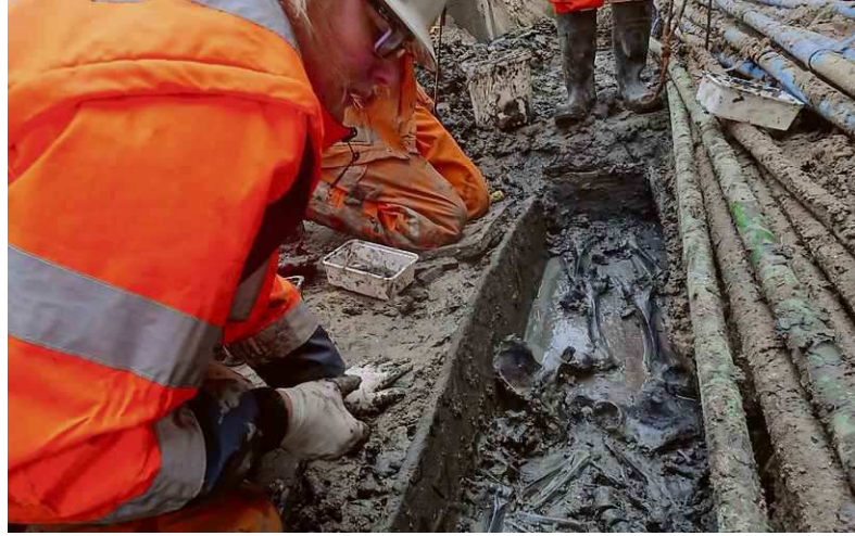
Archeologen van MUG verzamelen voorzichtig de beenderen. Bovenop deze kist lagen twee andere kisten, die eerder zijn opgegraven.

“DIT IS EEN STAP VOORUIT. IK KAN WEER VERDER