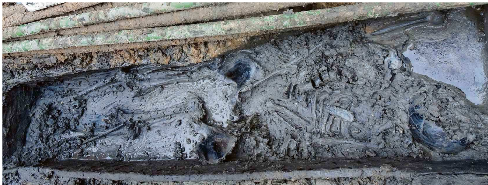
De archeologen groeven gisteren heel voorzichtig de resten van een menselijk lichaam uit. Het restant van de schedel is rechtsonder te zien en links de benen. Het lichaam lag met het hoofd naar het westen gericht. De kist lag half onder de kabels.