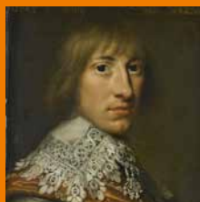
Hendrik Casimir I (1612-1640) stadhouder van 1632-1640