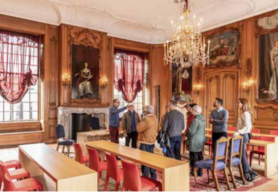
De Oranjezaal met vorstelijke portretten in het stadhuis