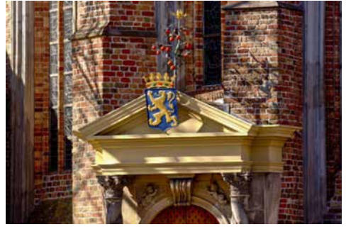
Bovendeel van het Oranjeportje van de Grote of Jacobijnerkerk

De stadhouderlijke graven in de Grote of Jacobijnerkerk