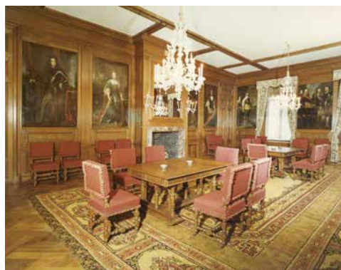
De Nassauzaal met portretten in het Stadhoudelijk Hof

De Friese stadhouders woonden tot 1747 in dit paleis. Daarna, toen Willem Carel Hendrik Friso met zijn hele hofhouding van 120 personen vertrokken was naar Den Haag om stadhouder van alle Nederlandse gewesten te worden, werd het Hof nog slechts gebruikt als logeeraadres voor de stadhouderlijke, later de koninklijke familie. In de Franse tijd had het gebouw