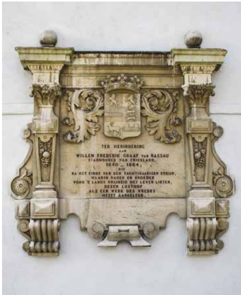
De gedenksteen in de zijmuur van het HCL