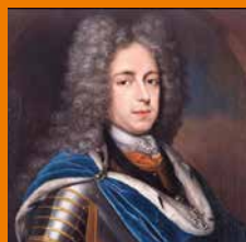
Hendrik Casimir II (1657-1696) stadhouder van 1664-1696