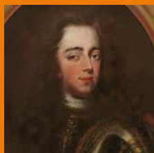
Johan Willem Friso (1687-1711) stadhouder van 1696-1711 (en prins van Oranje)