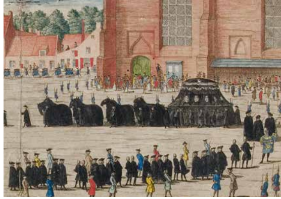
De lijkstatie van prinses Maria Louise voor de kerk in 1765