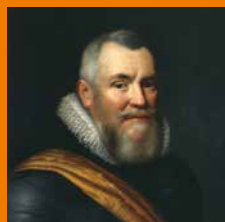
Willem Lodewijk (1560-1620) stadhouder van 1584-1620