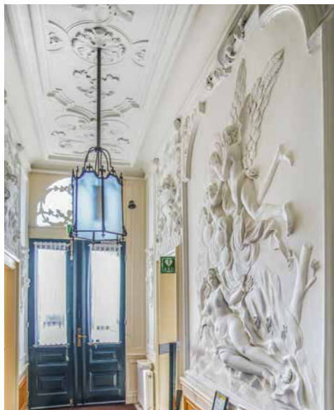
De gang van het Coulonhûs