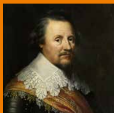
Ernst Casimir (1573-1632) stadhouder van 1620-1632