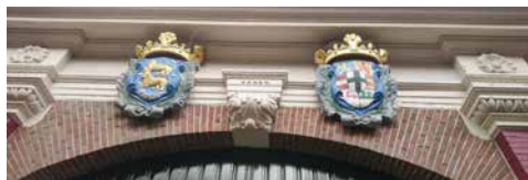
De wapens aan de gevel van de voormalige stadhoudelijke stallen in Grote Kerkstraat 15-17