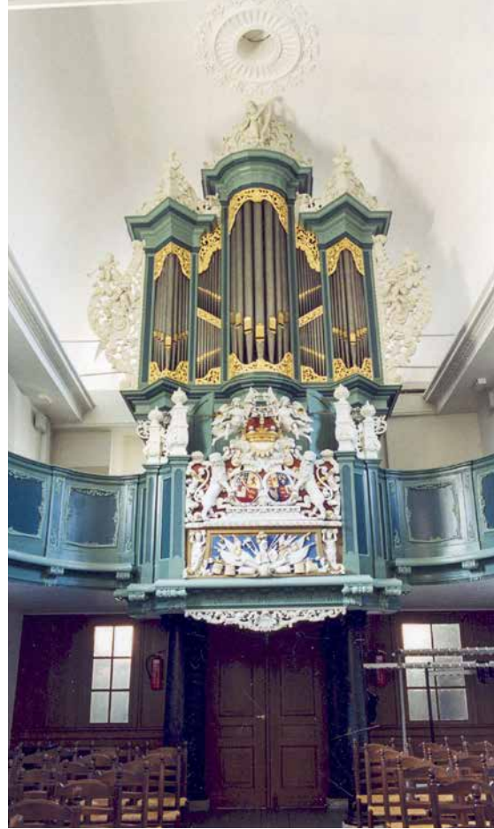
Interieur Waalse kerk met orgel

De Waalse kerk is in 1659 opgericht voor de Frans sprekende leden van de Hervormde Gemeente. Door de aanwezigheid van de stadhouders met hun hofhouding en het garnizoen was er een aanzienlijk aantal Franstaligen in Leeuwarden. En dat aantal groeide door de toestroom van gevluchte protestantse Walen. Hierdoor ontstond er behoefte aan een kerk waar in het Frans gepreekt werd. De kloosterkapel van het vroegere Sint Catharijneklooster