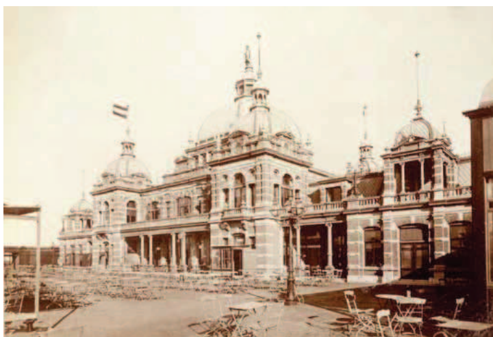
Café-Restaurant Seinpost is in 1976 gesloopt.

'Dien deftige stijl die imponeert' Architect Herman Wesstra Jr. (1843-1911) en zijn creaties. Auteur: Peter van Dam Uitgever: De Nieuwe Haagsche Prijs: € 29,95 ISBN: 978-94-91168-56-7