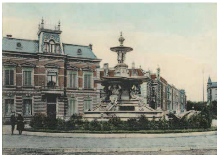
De door Wesstra ontworpen fontein op het Bankplein.