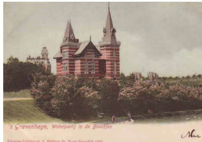
Villa Pauline, circa 1900, in de Scheveningse Bosjes.