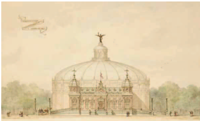
Het uit 1881 daterende Panoramagebouw aan de Bezuidenhoutseweg.