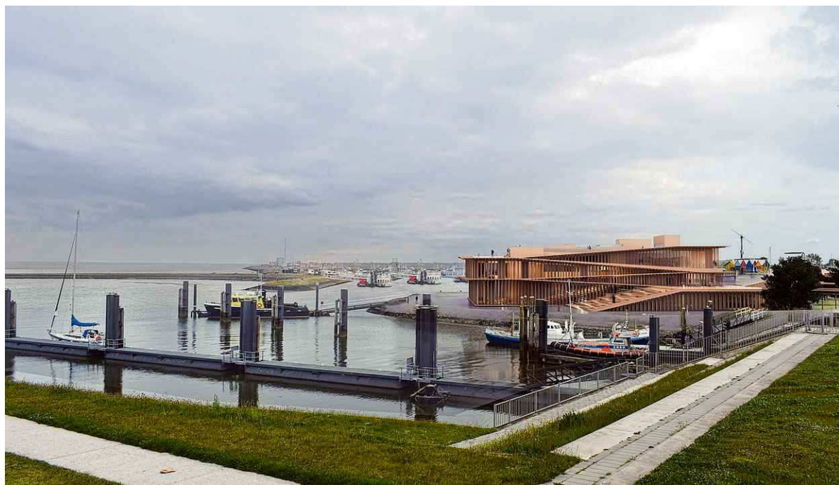
Nieuw voorlopig ontwerp van hete beoogde Werelderfgoedcentrum Lauwersoog.

Natuurclubs willen gebouw van maximaal 13 meter hoog