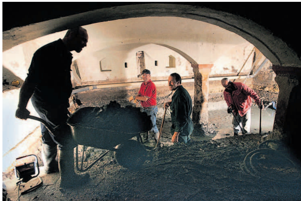
Graafwerk voor de verbouwing van het Patershuis in 2006.

Ook de Nieuwesteeg vormde zo’n welkome verbinding. De Oudegracht zou nog eeuwen blijven bestaan en werd pas in 1870 gedempt vanwege de ‘onwelriekende geur’ die eruit opsteeg.