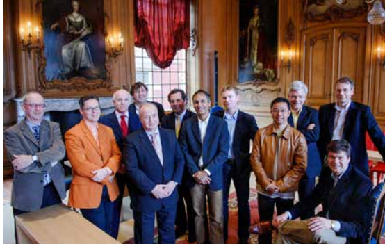
Homoburgemeesters met hun partners op bezoek in het Leeuwarder stadhuis op 7 april 2006.

In 1980 weigerde de gemeente Leeuwarden nog om geld te geven aan het COC. Vijf jaar later kwam daar verandering in toen