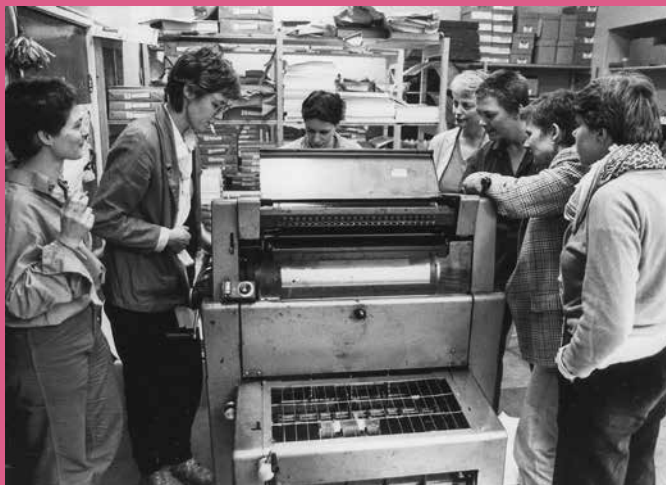
Bezetting van het Fries Service Centrum op 27 maart 1981.