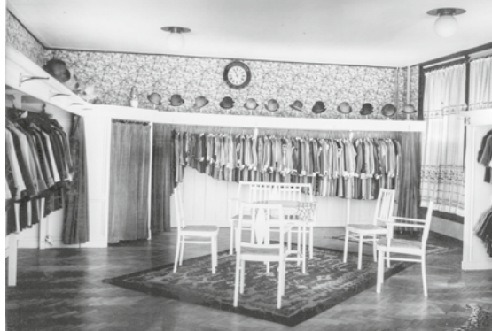
Interieur van de modezaak P.S. Bakker in 1929.

Ontwerp van de Mercuriusfiguur van de Mercuriusfontein, 1922.