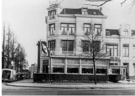
Hotel De Kroon, begin jaren 50.