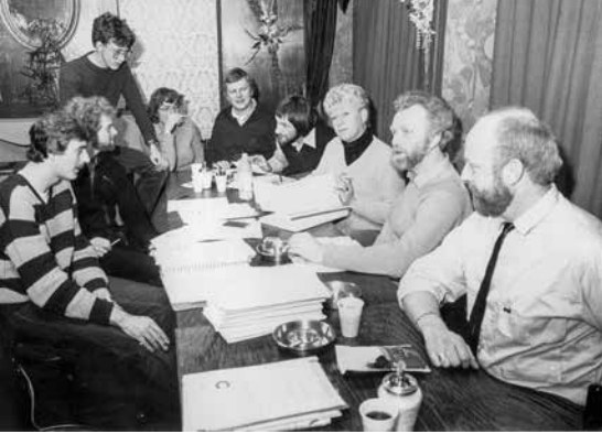
Het bestuur van COC Friesland in vergadering, begin jaren 80.