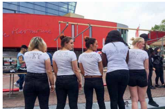
De presentatie van de regenboogtrap op 28 mei 2016.

De regenboogtrap op het Leeuwarder Mata Hariplein werd in mei 2016 officieel in gebruik genomen. De trap staat symbool voor het vieren van diversiteit en respect. Het initiatief dateert uit 2013 en was afkomstig van de VVD en fractie Brakenhoff