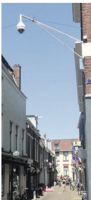
Meindert Tjoelker werd in 1997 in Leeuwarden doodgeschot. Vandaag hangen er overal camera's.

De Friese taal speelt in het museum een grote rol. Het wordt je direct duidelijk gemaakt dat er bij