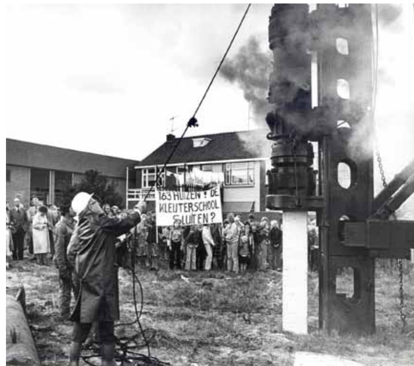
De eerste paal wordt geslagen op 18 september 1978.

De opdracht tot het maken van een definitief ontwerp werd uiteindelijk verleend aan de winnaar van de prijsvraag, de ontwerper van het plan Metamorfose, bureau Bonnema. De benamingen Linnaeusstraat, Marathonstraat, Dr. Jennerstraat, Schroeder van der Kolkstraat,