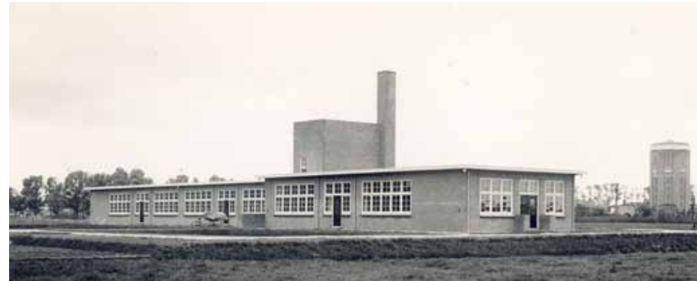
Het paviljoen voor besmettelijke ziekten aan de noordzijde van de Boerhaavestraat in 1930.

Het plan om het gebouw dienst te laten doen als opvangcentrum voor verpleging behoevende bejaarden of eventueel voor sociaal buurt- en jeugdwerk, strandde op de hoge renovatiekosten. Na diverse brandjes werd het pand in 1971 afgebroken en werd het vrijvallende terrein betrokken bij het park. Ook de voormalige portierswoning was zonder forse investeringen niet meer geschikt te maken voor bewoning en werd daarom eveneens gesloopt.