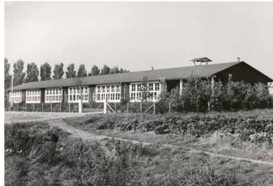
De Finse school aan de Boerhaavestraat omstreeks 1950.

In 1949 werd aan de Boerhaavestraat, ten oosten van het paviljoen voor besmettelijke ziekten, zo'n Finse school gebouwd ("school 30", daarna "Boerhaaveschool" en weer later "Zamenhofschool"). Na een uitbreiding in de jaren vijftig zou ook een dependance van kleuterschool "de Zwaluw" (later "de Spreeuw") in het gebouw gevestigd worden. Het complex "overleefde" een stevige (aangestoken) brand in 1968, maar verloor uiteindelijk zijn schoolfunctie. Het gebouw werd tijdelijk door een groep kunstenaars gebruikt als atelier en in 2004 werd het gesloopt. Op de vrijkomende locatie kwamen enkele tientallen appartementen.