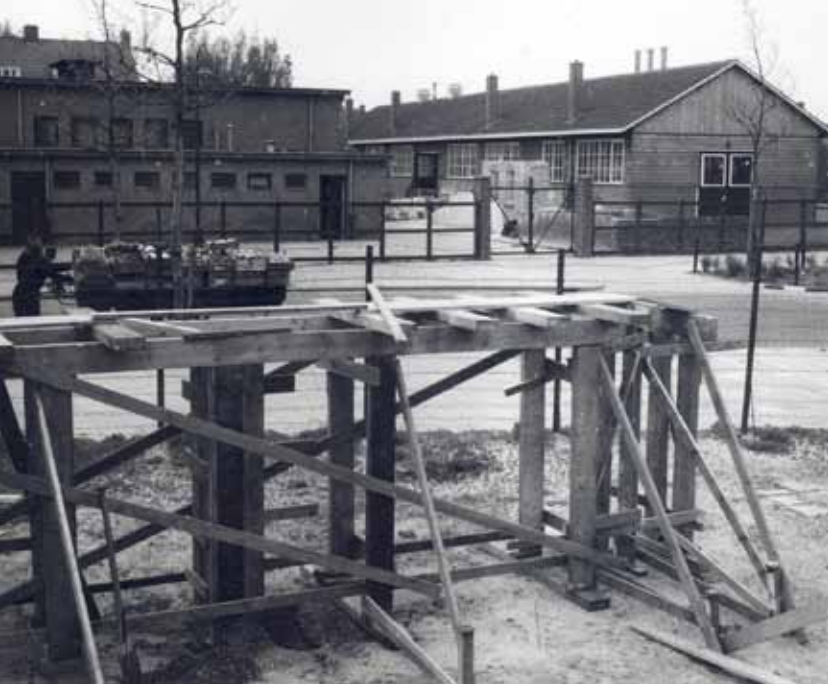
De Rijkswerkplaats voor vakontwikkeling aan de De Ruyterweg in 1955.

dergelijke voorzieningen ingericht. Het doel was om de nog aanwezige grondstoffen zo economisch mogelijk voor de voedselvoorziening te gebruiken. Per dag konden in de Leeuwarder vestiging 4000 maaltijden bereid worden. Deze waren af te halen tussen 11.00 uur en 12.30 uur. Eind 1945 kwam er een eind aan de Centrale Keuken. Ruim 5 miljoen porties eten waren er sinds de start verschaft. Met name in het laatste oorlogsjaar, toen de gasvoorziening in Leeuwarden stokte, werd dagelijks een enorme hoeveelheid eenpansmaaltijden verstrekt. De voormalige Centrale Keuken werd vanaf februari 1947 gebruikt als Rijkswerkplaats voor Vakontwikkeling van het Rijksarbeidsbureau. Hier werd aan grote groepen ongeschoolden, gedemobiliseerden en terugkerende oorlogsvrijwilligers een vakopleiding (“snelscholing”) gegeven. Zo werd getracht tegemoet te komen aan de toenemende vraag naar geschoolde krachten,