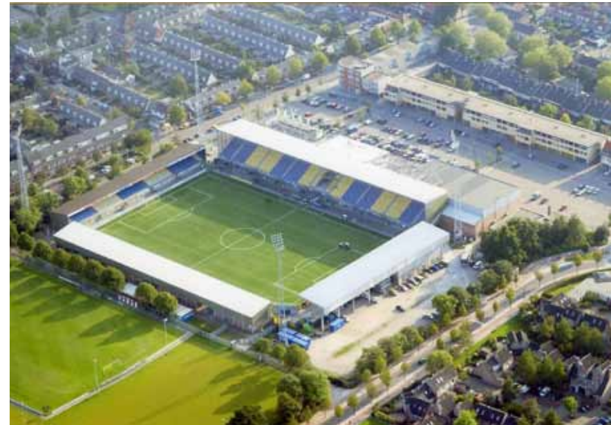
Het Cambuurstadion vanuit de lucht in 2005.

hockeyvereniging RAP werden in 1936 de eerste bespelers en zouden tot in de jaren zestig gebruik blijven maken van het sportpark. Aan de westkant van het terrein werd een tribune opgetrokken naar ontwerp van gemeentearchitect Zuidema. Deze bood plaats aan 500 toeschouwers. De geplande aanleg van tennisbanen aan de noordkant en de aanleg van een sintelbaan werden “vooralsnog” uitgesteld. Rondom de velden werd een vijf meter brede singel gepland als afscheiding van de omliggende wegen. “De accommodatie is zóó schitterend dat zelfs de meest verwenden onder de voetballers er tevreden over kunnen zijn” merkte de krant op (L.C., 11-09-1936). Van deze tevredenheid was direct na de oorlog geen sprake meer. De grasmat verkeerde in erbarmelijke staat doordat het terrein in de oorlogsjaren was verhuurd als hooiland. De tribunecapaciteit was volstrekt onvoldoende om de toenemende publieke belangstelling op te kunnen vangen. Diverse toeschouwers kwamen met trapjes of kistjes of huurden een staanplaats op een platte wagen. Door