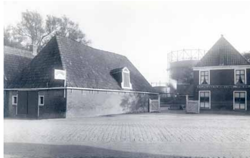
Herberg De Bleek omstreeks 1920.

Op de westelijke hoek van de Groningerstraatweg en de Bleeklaan heeft lange tijd herberg De Bleek gestaan. Rond deze oude herberg lagen al in de achttiende eeuw enkele terreinen waar blekerijen werden geëxploiteerd en waar men bleekvelden kon huren. Bij de herberg was volop gelegenheid om de paarden van reizigers uit te spannen. De herberg werd geëxploiteerd door de familie Klopma. Het etablissement was een trefpunt voor alle rangen en standen. In 1874 kocht de gemeente het pand aan met het doel hier een ziekenhuis te bouwen, maar dit plan bleef in de la. De herberg verloor gaandeweg haar functie en kwaliteit. In de jaren twintig werd er druk uitgeoefend op de gemeente om het pand af te breken en er een "wagenpark" aan te leggen. Dit zou de oostelijke entree van de stad opwaarderen en het zou een stallingsmogelijkheid bieden voor het drukke vrachtautoverkeer. Een deel van het terrein werd in 1928 daartoe ingericht. Het overige deel, inclusief de herberg, kwam vijf jaar later in handen van de gasfabriek. In 1941 werd de herberg gesloopt in verband met de plannen voor een nieuw kantoorgebouw van de Gemeentelijke Lichtbedrijven.