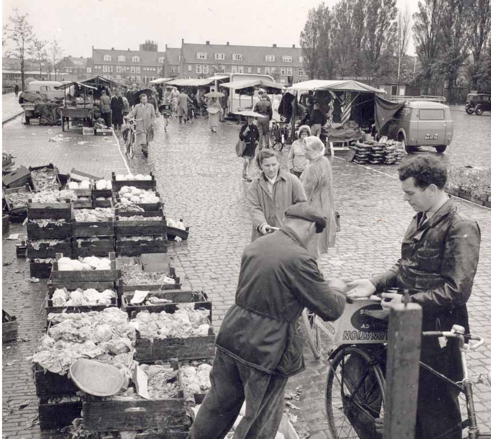
Dinsdagmarkt op het Cambuurplein, 1957.