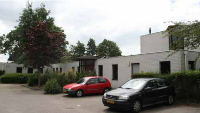
De Wending aan de Albert Schweitzerstraat.

was bedoeld voor de tijdelijke huisvesting van mensen die uit huis gezet waren of uit huis waren weggegaan. In 2009 verhuisde de crisisopvang van Limor naar Bilgaard. Opvangorganisatie Zienn nam het pand vervolgens in gebruik voor de opvang van jongeren en vervolgens voor sociaal pension "De Bel", dat kortgeleden weer verhuisd is naar de Hoekstersingel.