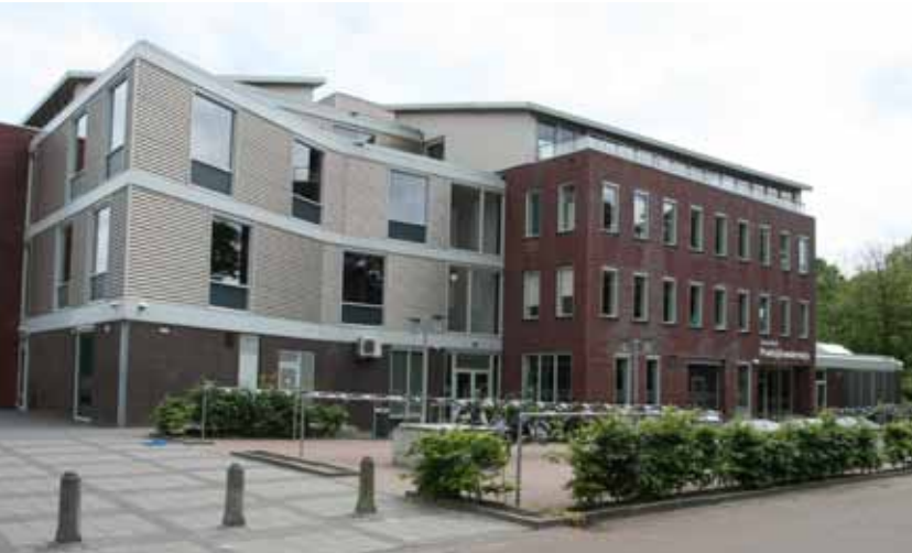
CSG Comenius Zamenhof.

Christelijke Scholengemeenschap Comenius startte in 2008, op de locatie van de gesloopte Prinses Marijkeschool en Marnixschool, in een nieuw gebouw (van Grunstra architecten) met praktijk- en vmbo-onderwijs. Dit gebouw biedt ruimte aan 800 leerlingen. Aan de kant van het Zamenhofpark is een ingang voor het praktijkonderwijs.