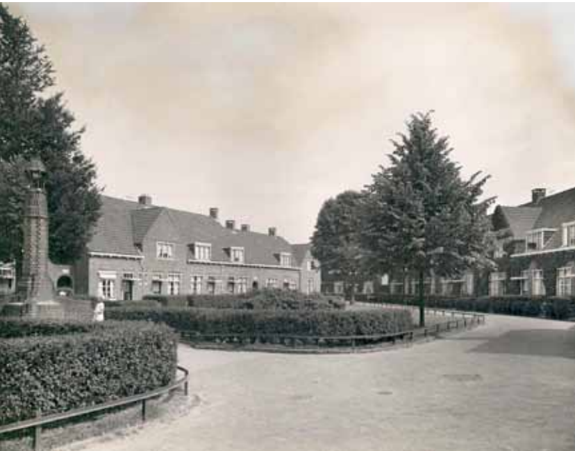
Gezicht op het Koeplein omstreeks 1935, met links het plantsoen met monument.

De architectuur van de huizen rond het Koeplein is sterk beïnvloed door de Amsterdamse School. Het merendeel van de bebouwing bestaat uit grondgebonden woningen. Op vier hoeken staan woongebouwen, die elk twee beneden- en twee bovenwoningen bevatten en bedoeld zijn voor kleine gezinnen. De straathoeken worden geaccentueerd door lage, geronde tuinmuren. Op de daken liggen oranjegele gegolfde Friese pannen die het complex een kleurig karakter verlenen. Er is zorg besteed aan het metselwerk. Ruimtelijk is de buurt aantrekkelijk. De rijtjes worden doorbroken door stegen met rond gemetselde poortjes. Het complex “De Oude Weide” is van architectuurhistorisch belang omdat het ontwikkelingen in de bouw van arbeiderswoningen laat zien. Mede daarom staat een deel van het complex op de gemeentelijke monumentenlijst. Aan het Koeplein staan twee rijen woningen die schuin zijn geplaatst en voor een belangrijk deel bijdragen aan de vorming van het plein. Het