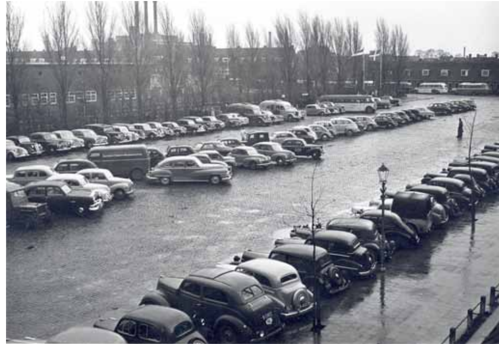
Het Cambuurplein als parkeerterrein tijdens een voetbalwedstrijd in 1951.

Aan de noordwestzijde van het plein is in 1961 nog een klein aantal woningen gebouwd. Het automobiel- en garagebedrijf “Modern” (Mobil) was destijds de eerste gebruiker van een pand met een