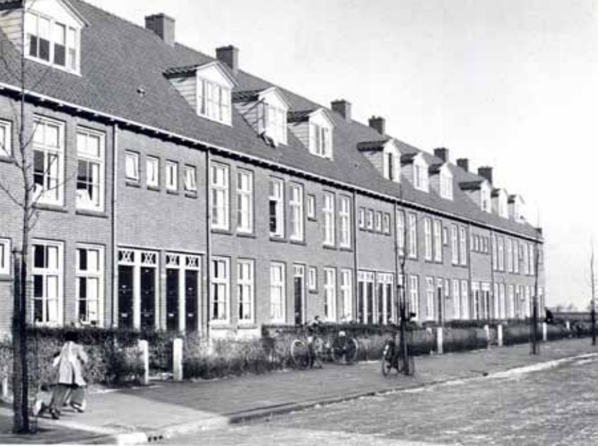
De Linnaeusstraat noordzijde, het oostelijk uiteinde, in 1952.

verklaarbaar omdat daar immers gemeentewoningen stonden. De woningen waren relatief goedkoop en beschikbaar, omdat een deel van de oorspronkelijke bewoners alweer doorstroomde naar nieuwbouwwoningen, bijvoorbeeld in Schieringen. Op verzoek van de gemeente werd eind 1960 en begin 1961 onderzoek verricht naar de vormen van onaangepast gedrag in de Linnaeusbuurt. De huishoudingen in de buurt konden grotendeels tot de laagste klassen van de samenleving gerekend worden. Bijna een derde van het aantal gezinnen uit de buurt had bij instellingen hulp gevraagd of er moest vanuit het oogpunt van kindbescherming ingegrepen worden. Bijna 85% van de onaangepaste gezinnen was pas na 1954 in de buurt komen wonen. De resultaten van het onderzoek waren schokkend en opzienbarend en al gauw bekend in de stad. Dit versterkte de (voor)oordelen over de Linnaeusbuurt en zorgde ervoor