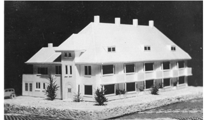
Maquette van een ontwerp van architect Piet de Vries voor woningen aan de Groningerstraatweg

De nummers 54 tot en met 60 van de Groningerstraatweg mogen monumentaal worden genoemd. Het betreft een rij herenwoningen uit 1937 van architect Piet de Vries. Bijzonder is de dubbele villa op nummers 32 en 34 die in 1929 in Amsterdamse Schoolstijl is ontworpen, eveneens door Piet de Vries.