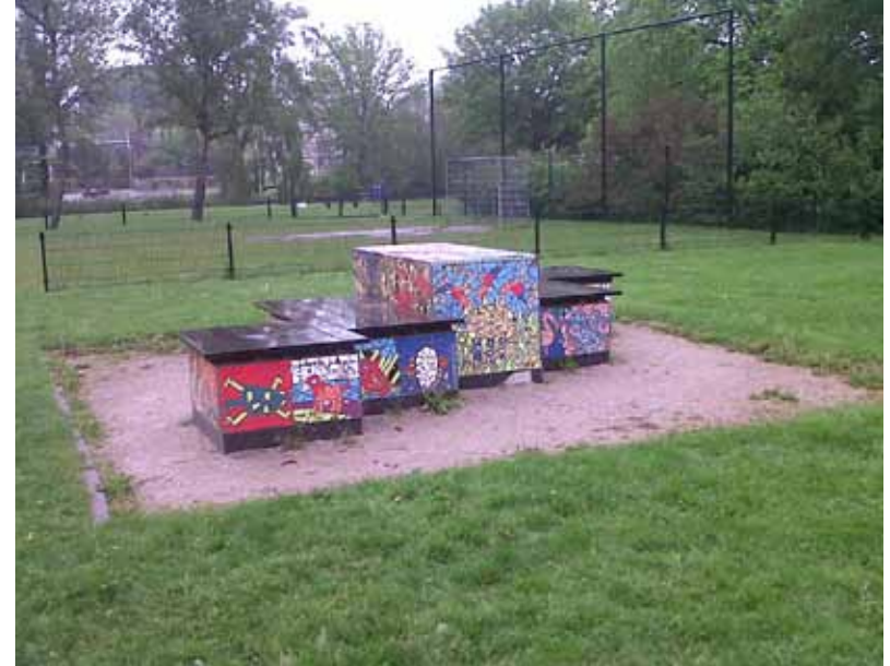
De Gaudi-bank in het Dr. Zamenhofpark.

“In het oosten van de stad heeft zich een comité gevormd, dat de bescherming van het Oosterpark wil propageren bij de omwonenden. In een circulaire richt het comité zich tot hen en vraagt speciaal de ouderen er op te willen toezien dat de jeugd niet meer voetbalt en verstoppertje speelt. Voor deze spelletjes vindt het comité het park te duur en adviseert het de ouders de jeugd voorlopig naar het braak liggende stuk land ten oosten van de Archipelweg te sturen”. (L.C. 13 juli 1957).