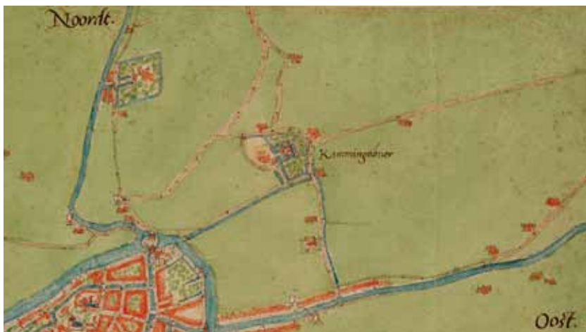
Uitsnede van de stadsplattegrond uit ca. 1560.

Het Kalverdijkje, een landweggetje dat ter hoogte van het huidige Groningerplein aansloot op de Groningerstraatweg, was tot in de tweede helft van de twintigste eeuw grotendeels onbebouwd. Het dijkje liep in oostelijke richting, dwars door de later te bouwen Linnaeusbuurt, over de Schieringersloot, om verderop weer af te buigen in noordelijke richting en opnieuw uit te komen op de Groningerstraatweg ter hoogte van het tolhuis. Langs het Kalverdijkje werd lange tijd het melkvee naar de verschillende daaraan gelegen boerderijen gedreven. Geleidelijk veranderde het van een modderige landweg in een puindijk en nog weer later tot een "kunstweg".