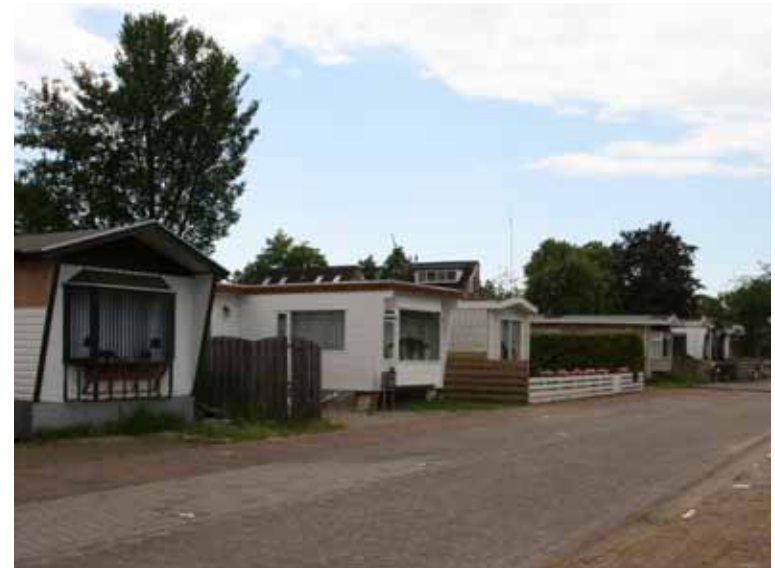
Het woonwagencamp.

In de jaren negentig waren er diverse conflicten tussen een kampbewoner en de andere woonwagencampbewoners en de buurtbewoners. Aanleiding daartoe vormde het autosloopbedrijf dat vanuit de woonwagen van de betreffende bewoner werd geëxploiteerd. Het vertrek van de bewoner en zijn bedrijf bleek de oplossing.