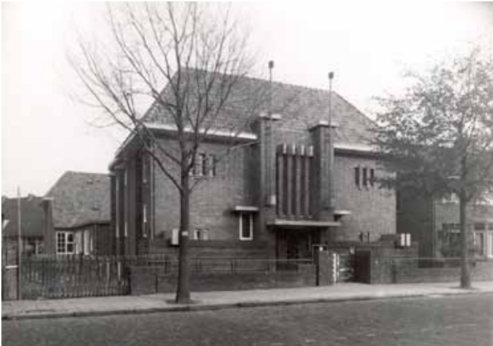
“Ons Huis” aan de Bleeklaan in 1929.