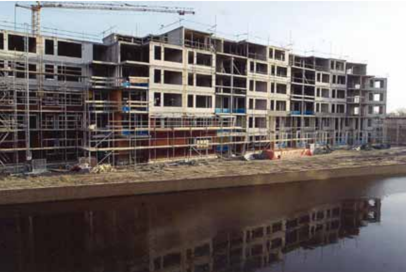
Bleekhoven in aanbouw in 2000.

Penta Architecten uit Harlingen was inmiddels benaderd door de grondeigenaar, aannemersbedrijf Visser, om een nieuw bouwplan te maken. Het prijswinnend ontwerp van 1987 was achterhaald, vooral door de veranderde vraag naar grotere, kwalitatief betere woningen.