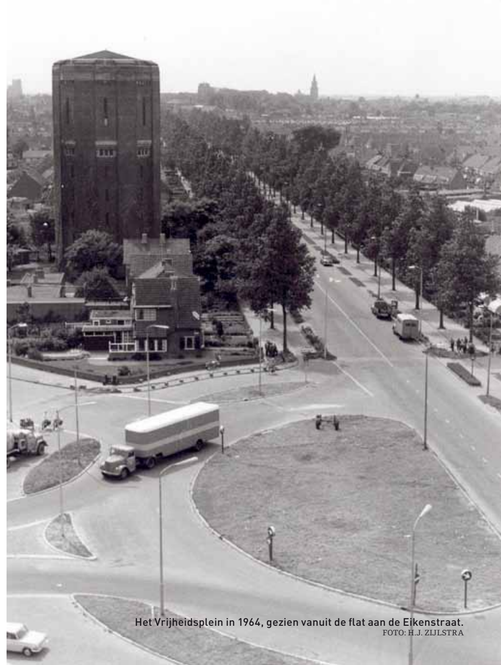
Het Vrijheidsplein in 1964, gezien vanuit de flat aan de Eikenstraat.

Het Vrijheidsplein is een belangrijke schakel in het oostelijke en noordelijke deel van de rondweg. In 1952 werd het in een uitbreidingsplan nog gestippeld ingetekend "aangezien het ons minder wenselijk voorkomt de vorm van een dergelijk belangrijk verkeersplein thans reeds vast te leggen" , aldus het college van B&W. In 1958 kreeg het plein al enige vorm; bij de aantakking van de Pasteurweg op de Groningerstraatweg werd een rond verkeersplein ontworpen, waarvan het zuidelijke deel begin jaren zestig werd aangelegd. In 1963 werd aan het (toen nog niet voltooide) plein de naam Vrijheidsplein toegekend, omdat de bevrijders in 1945 op deze plaats de stad binnentrokken. Daar ging nogal wat discussie aan vooraf. Menigeen vond de naam te algemeen, waardoor er diverse suggesties volgden, zoals: Plein 15 april 1945, Canadaplein, Canadezenplein, Henri Dunantplein, Bevrijdingsplein.