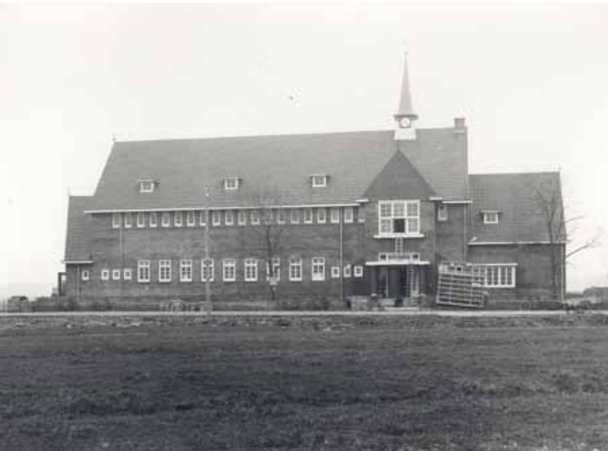
De Parkschool aan de Boerhaavestraat in 1932.

De oorspronkelijke naamgeving van de school vergde weinig hoofdbreken en creativiteit; School 16 aan de Coornhertstraat was immers enkele jaren eerder (1929) geopend. Later volgde de vernoeming naar het nabijgelegen Oosterpark. Toen dat park in 1959 werd omgedoopt tot Dr. Zamenhofpark lag de volgende naam voor de hand. Wellicht vanuit kostenoverwegingen (er hoefden slechts zes