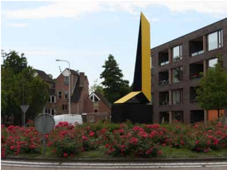
De rotonde met “Obelisk”.

Door de afbuiging van de Coopmansstraat naar de Archipelweg kwamen de flats van St. Joseph geïsoleerd te liggen. Dat, én het feit dat deze flats geen hoge kwaliteit hadden en een negatief contrast zouden vormen met het nieuwbouwplan, maakte het besluit tot afbraak gemakkelijker. Het, in 1988 opgeleverde, kantoorpand op die locatie bood huisvesting aan het Centraal Bureau voor de Rijvaardigheid, de Friese Bondsspaarbank en aannemer BAM-Kolk.