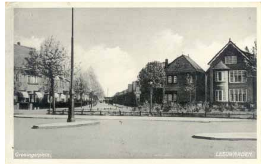
Prentbriefkaart van Groningerplein en Camminghastraat omstreeks 1930.