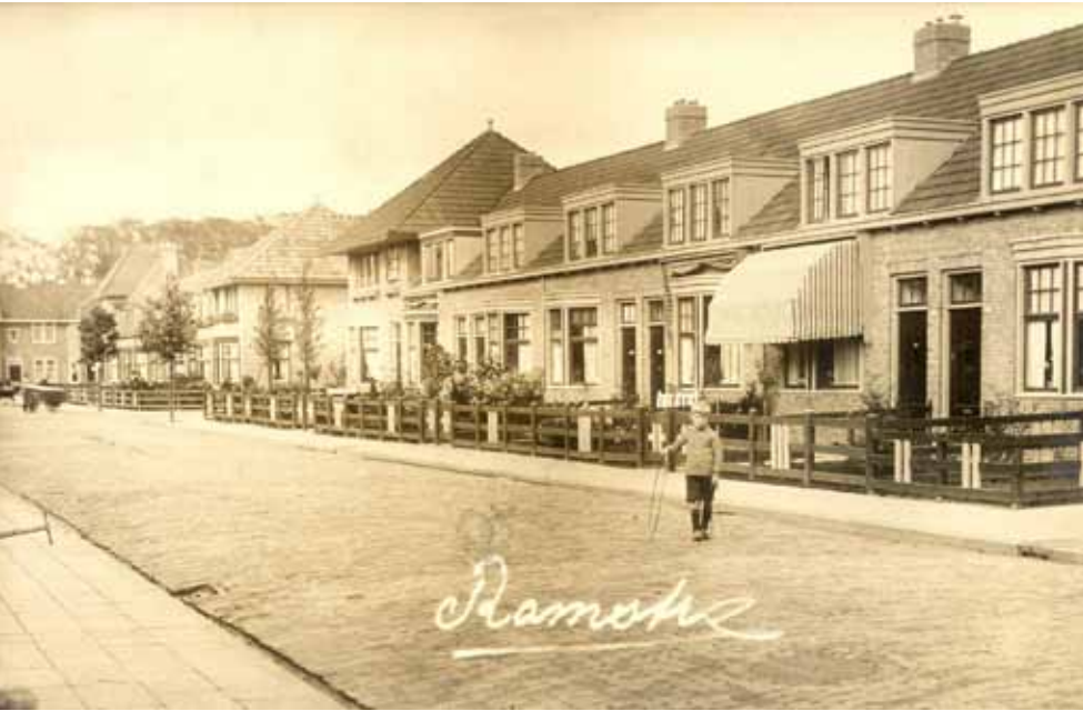
De Ramstraat op een prentbriefkaart uit 1926.

Een ontwerp-uitbreidingsplan uit 1915 hield reeds rekening met aanleg van straten en de bouw van arbeiderswoningen in de oostelijke stadsrand. In een aangepast plan uit 1917 werd een sportterrein annex tentoonstellingsterrein geprojecteerd op de plaats van het huidige Cambuurcomplex. Ten noorden daarvan waren de contouren te herkennen van de latere Linnaeusbuurt en was er een plantsoen ingetekend, het latere Oosterpark. In 1920 kocht de gemeente een groot aantal percelen weiland aan (voor een gulden per m 2 ) ten behoeve van deze stadsuitbreiding.