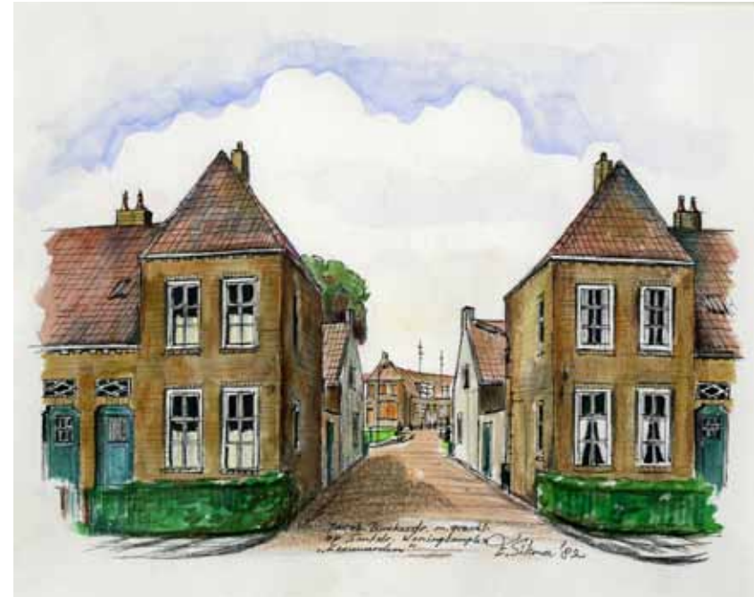
Jacob Binckesstraat en Sontstraat gezien vanuit het oosten in 1982. PEN-EN PENSEELTEKENING, EDDY SIKMA

Ruim tien jaar later kwam woningbouwvereniging Beter Wonen met sloopplannen voor 132 woningen aan de Barent Fockesstraat, de Sontdwaarsstraat, de Nieuw-Amsterdamstraat, de Jacob Binckesstraat en het Cambuursterpad. De huurderswerkgroep en bewoners van dit deel van de buurt hadden andere gedachten. Er werd uiteindelijk