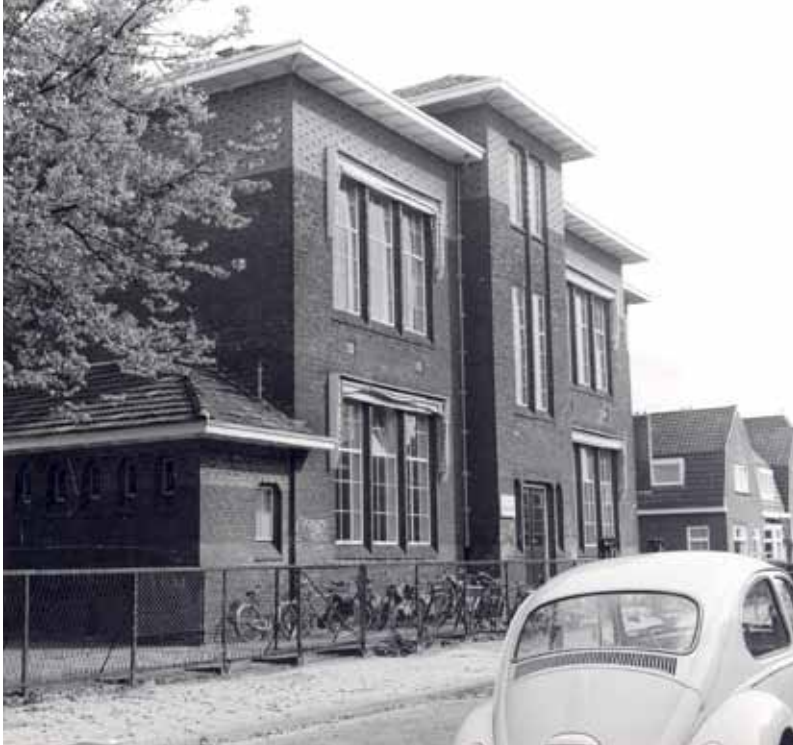
De Tjerk Hiddesschool in 1967.

Rond 1920 werd een gebrek aan schoolruimte geconstateerd, zeker in het noorden en noordoosten van de stad waar nieuwe woonuitbreiding was voorzien. Als locatie voor een nieuwe school werd gedacht aan een deel van het bouwterrein tussen de Groningerstraatweg, het Kalverdijkje en het Cambuursterpad. Toenmalig gemeentearchitect Van Hylckama Vlieg ontwierp een blokvormig schoolgebouw met 14 leslokalen. Achter de school kwam een speelplein.