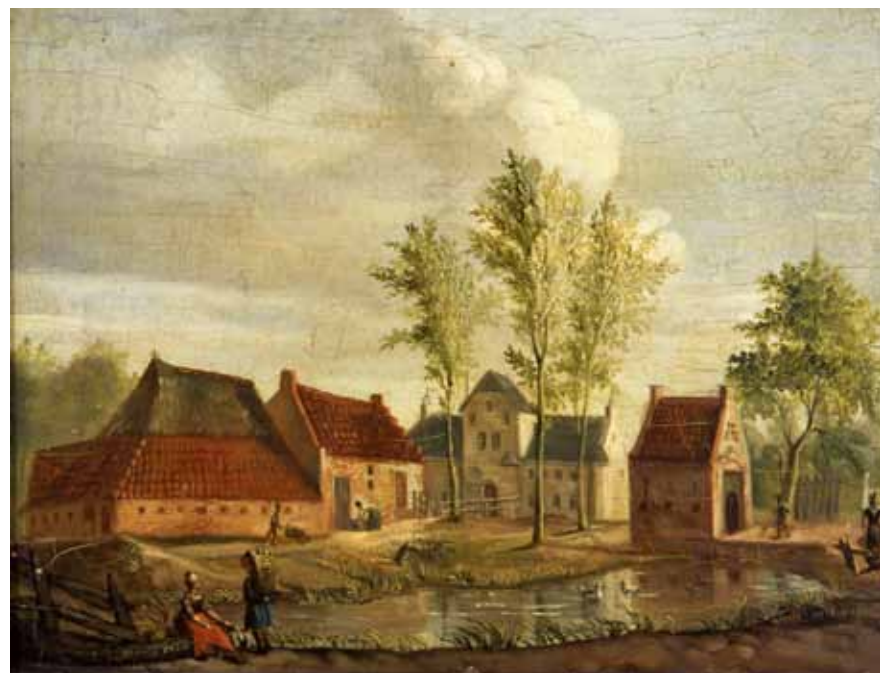
Gezicht op Camminghastate en omgeving. Schilderij, 1832. FRIES MUSEUM

Het uit 1542 stammende Kalverdijkje liep ooit met een boog om het terrein van het slot Camminghaburg of Cambuur. Met de ogen van nu: rond de kruising van de Ramstraat en de Schapestraat. De naam Cambuur is een verkorte vorm van Camminghaburen, een buurschap die al aan het eind van de twaalfde eeuw op deze plaats wordt genoemd. De verbinding tussen Cambuur en de stad werd gevormd door het Cambuursterpad (in 1682 "De Opgangh van Cambuyr", later nog "Cambuyrsterzingel"). Aan de zuidzijde van dit pad liep een vaart met enige bebouwing daarlangs. De vaart, die in 1916 werd gedempt, boog nabij het Schoppershof in zuidelijke richting af. In de verkaveling tussen de Barent Fockesstraat en de De Ruyterweg is dit nog te herkennen.