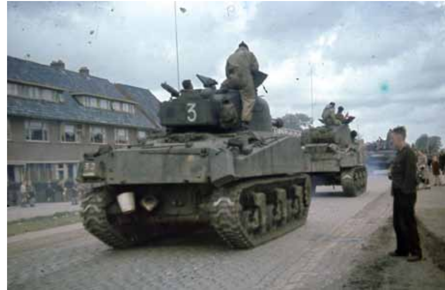
Canadese bevrijders op de Groningerstraatweg in 1945.