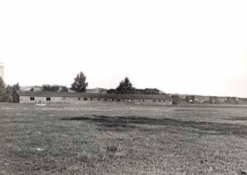
De schietbaan in 1929.