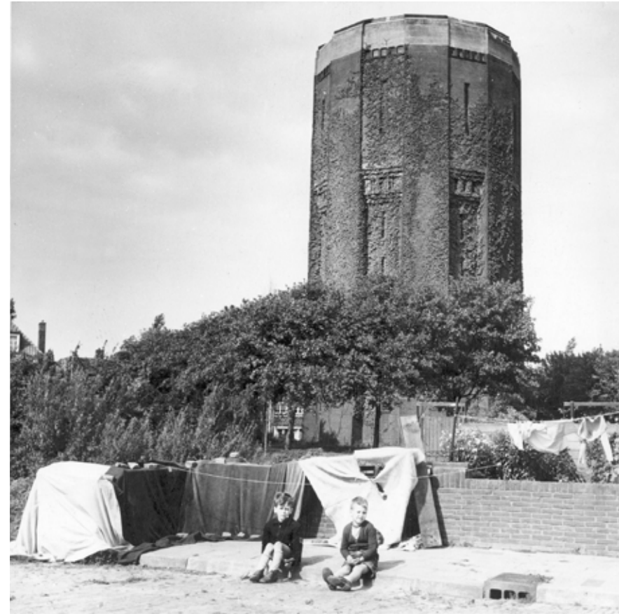
De watertoren in 1956, gezien vanaf de Pasteurweg.

In de Leeuwarder Courant werd in 1922 over de oude watertoren aan het Zuiderplein het volgende gezegd: "De capaciteit van den watertoren laat niet toe dat 't water gebruikt wordt voor het schrobben van stoepen en straten. Daarom wordt er van politiewege ernstig gewaarschuwd tegen overtreding van het desbetreffende verbod. Bij het constateeren van deze overtreding wordt proces verbaal opgemaakt, terwijl men ook niet zal terugschrikken voor het afsnijden van den watertoevoer". Capaciteitsuitbreiding was noodzakelijk en nog in datzelfde jaar werden maatregelen genomen. Samen met enkele buurgemeenten, verenigd in de I.W.G.L., werd