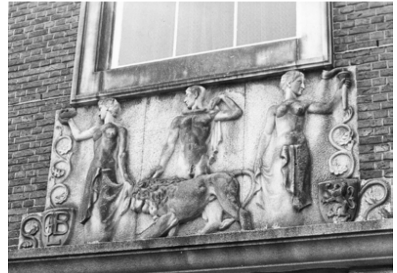
Gevelreliëf boven de entree.

Gemeentearchitect Justus Zuidema tekende voor het ontwerp. In 1941 werd met de bouw gestart die al snel daarna werd stilgelegd in verband met de oorlog. Door materiaalschaarste en een tekort aan arbeidskrachten bleek een snelle doorstart niet mogelijk en kon er pas in 1948 verder gebouwd worden. Boven de ingangspartij van het gebouw is een gevelreliëf aangebracht. Deze is gemaakt door beeldhouwster Ida Baanders-Kessler, die in 1915 in Leeuwarden werd geboren.