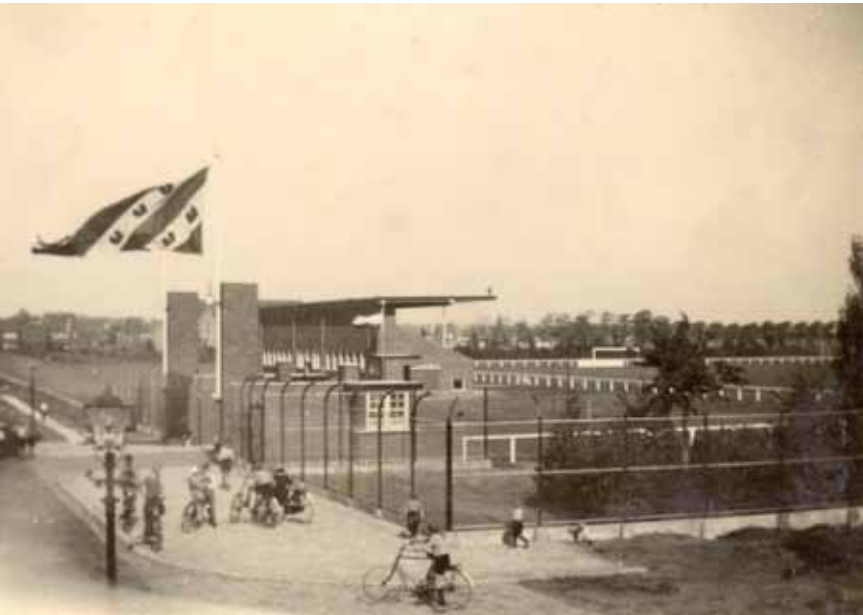
Sportpark Cambuur in 1938, gezien vanuit het zuidwesten.

hockeyvereniging RAP werden in 1936 de eerste bespelers en zouden tot in de jaren zestig gebruik blijven maken van het sportpark. Aan de westkant van het terrein werd een tribune opgetrokken naar ontwerp van gemeentearchitect Zuidema. Deze bood plaats aan 500 toeschouwers. De geplande aanleg van tennisbanen aan de noordkant en de aanleg van een sintelbaan werden “vooralsnog” uitgesteld. Rondom de velden werd een vijf meter brede singel gepland als afscheiding van de omliggende wegen. “De accommodatie is zóó schitterend dat zelfs de meest verwenden onder de voetballers er tevreden over kunnen zijn” merkte de krant op (L.C., 11-09-1936). Van deze tevredenheid was direct na de oorlog geen sprake meer. De grasmat verkeerde in erbarmelijke staat doordat het terrein in de oorlogsjaren was verhuurd als hooiland. De tribunecapaciteit was volstrekt onvoldoende om de toenemende publieke belangstelling op te kunnen vangen. Diverse toeschouwers kwamen met trapjes of kistjes of huurden een staanplaats op een platte wagen. Door