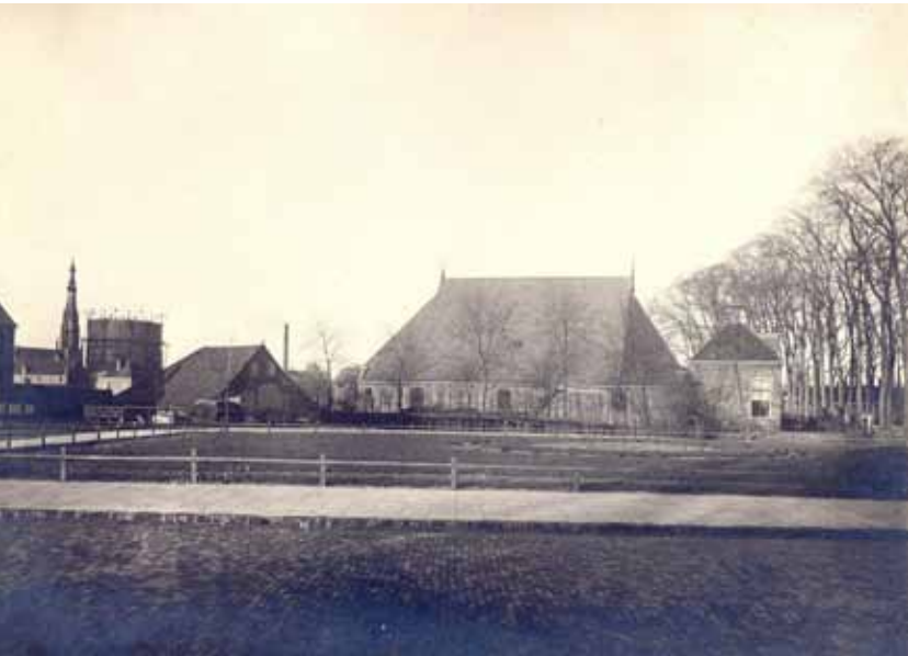
Boerderij op de voormalige hoek van het Kalverdijkje, bij het huidige Groningerplein, in 1922.

straat bevond zich een boerderij, evenals bij de kruising van de De Ruyterweg en de Barent Fockesstraat. Beide werden begin jaren vijftig afgebroken. Afbraak was in alle gevallen onafwendbaar; ofwel omdat de boerderij volledig werd ingesloten door woonbebouwing, ofwel omdat extra bouwgrond nodig was en ook vanuit verkeerstechnische overwegingen.