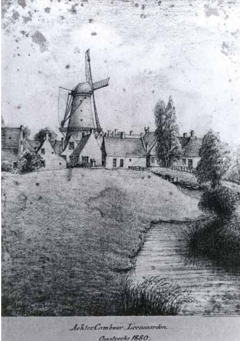
Gezicht op de Weg naar Cambuur met molen "De Herderin". Potloodtekening van David Vonk, circa 1880. FRIES MUSEUM

Langs de in noord-zuid richting lopende "Weg naar Cambuur" ("Achter Cambuur") was enige bebouwing (onder andere het Schoppershof buurtje). Lange tijd stond aan deze weg een molen: "De Herderin", ook wel "De Blauwe Molen" genoemd naar de Blauwe Brug aldaar. Deze molen was afkomstig uit Zaandijk en werd in 1829 in Leeuwarden gebouwd als oliemolen. De molen werd gedemonteerd in 1892 en vervolgens herbouwd in Minnertsga.