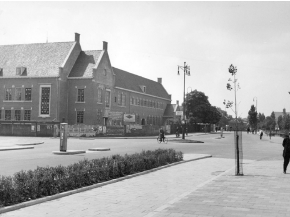
Het kantoor van de Gemeentelijke Lichtbedrijven in aanbouw in 1948.

In 1949 werd het nieuwe kantoor voor de Gemeentelijke Lichtbedrijven officieel geopend. “Een kloek en gaaf gebouw, een sieraad voor dit deel der stad”, sprak burgemeester Van der Meulen. Al in 1940 werd besloten tot de nieuwbouw van een kantoor met magazijnen en werkplaatsen op het parkeerterrein bij herberg De Bleek. Het oude kantoorpand bij de gasfabriek aan het Hoeksterend was sterk verouderd en te klein. Als één van de nieuwbouwargumenten noemde het college van B&W: “Het publiek wordt te woord gestaan voor een klein loketje, waarbij, wanneer het geopend wordt bij harden wind, de papieren van de lessenaars waaien”.