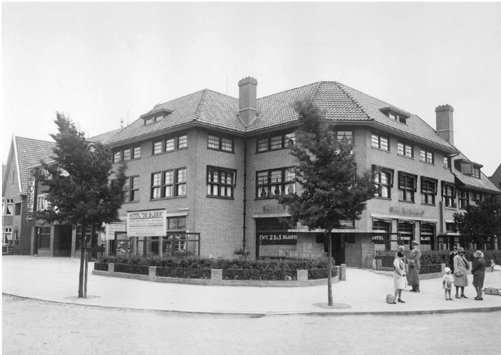
Hotel De Bleek omstreeks 1935.