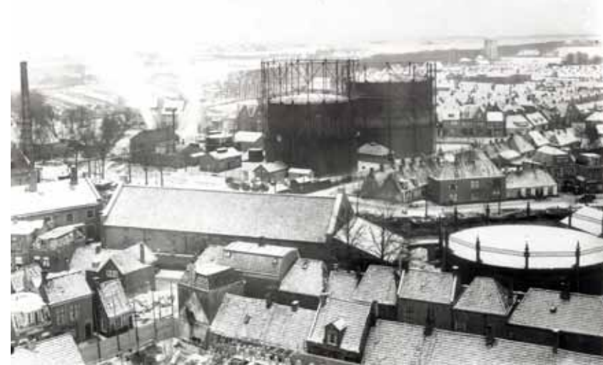
Panorama vanaf de Sint Bonifatiustoren naar het noordoosten omstreeks 1935, met in het midden de gasfabriek.

Al in 1845 werd op het Hoeksterend een bescheiden gasfabriek opgericht, die geëxploiteerd werd door particulieren. Twintig jaar later kwam de fabriek in gemeentelijke handen en werd het complex geleidelijk aan uitgebreid. Door de groei van de stad en (dus) de groei van de vraag naar gas, werd begin twintigste eeuw voorzien dat de gasfabriek op termijn niet de noodzakelijke hoeveelheid kolengas zou kunnen leveren. De gemeente besloot op een terrein aan de overkant van de gracht, behorend tot herberg De Bleek, een watergasfabriek te bouwen (1905), om (tijdelijk) extra productie te kunnen leveren. Enkele malen is overwogen om de gasfabriek te verplaatsen naar een locatie met voldoende uitbreidingsmogelijkheid. Dit bleek echter onnodig omdat op de dubbellocatie toch genoeg geproduceerd kon worden. De gescheiden delen van het fabrieksterrein werden verbonden door een elektrisch bruggetje. Blikvangers waren de kolossale gashouders, die goed waren voor de opslag van maximaal 12.000 m 3 gas. Op de terreinen stonden verder diverse gebouwen, schuren, ovens en machinekamers. Na 115 jaar, in eind 1960, kwam er een eind aan de Leeuwarder gasfabriek. Leeuwarden schakelde van kolengas over op aardgas. Het gasbedrijf verloor zijn producerende taak en kreeg vooral een verkopende en distribuerende rol.