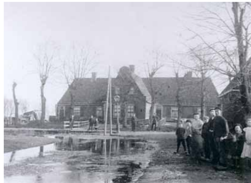
Schoppershof omstreeks 1925.

Tussen het Schoppershof en School 17 (Parkschool) lag een terrein dat in de jaren dertig werd gebruikt als kaatsveld voor vereniging De Oosthoek. "Entrée 24 cent, werkloozen 14 cent, jongens 12 cent". Later zou een terrein op sportpark Cambuur hiervoor benut worden. Nadat de gemeente halverwege de jaren vijftig alle woningen aan het Schoppershof in eigendom had verkregen, werden de bouwvallige huizen stuk voor stuk afgebroken. Voor een deel van het vrijgekomen terrein kwam pas enkele jaren later een gegadigde.