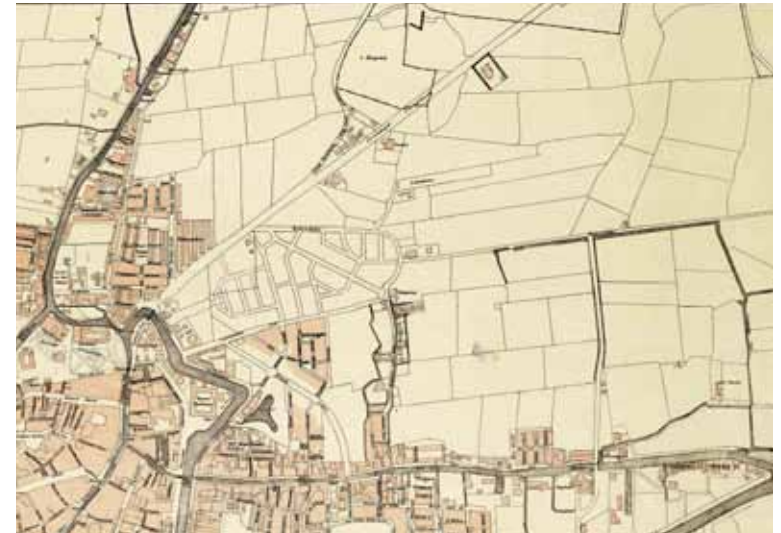
Uitsnede van de stadsplattegrond uit 1919.

Met de Woningwet van 1901 werd ook Leeuwarden verplicht om een uitbreidingsplan op te stellen met het toekomstig stratenplan en de stedelijke uitbreiding. De woningnood was rond 1915 dramatisch; de gemeente probeerde de bouw van arbeiderswoningen te bevorderen.