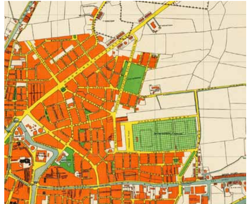
Uitsnede van de stadsplattegrond van 1943.

Op de kaart uit 1943 staat het Oosterpark al ingetekend, inclusief de bebouwing ten noorden daarvan (Robert Kochstraat en omgeving). De Pasteurweg, met een directe aansluiting op de Groningerstraatweg, werd een belangrijke nieuwe ontsluitingsweg. De Weg naar Cambuur is omgedoopt tot De Ruyterweg en het eerste deel van de Poppeweg tot Archipelweg. De Insulindestraat is doorgetrokken tot de Archipelweg en het gebied ten zuiden daarvan (Indische buurt) is verder afgerond. De Frederik Ruyschstraat is eveneens doorgetrokken. Sportpark Cambuur was al enkele jaren in gebruik, met de Insulindestraat