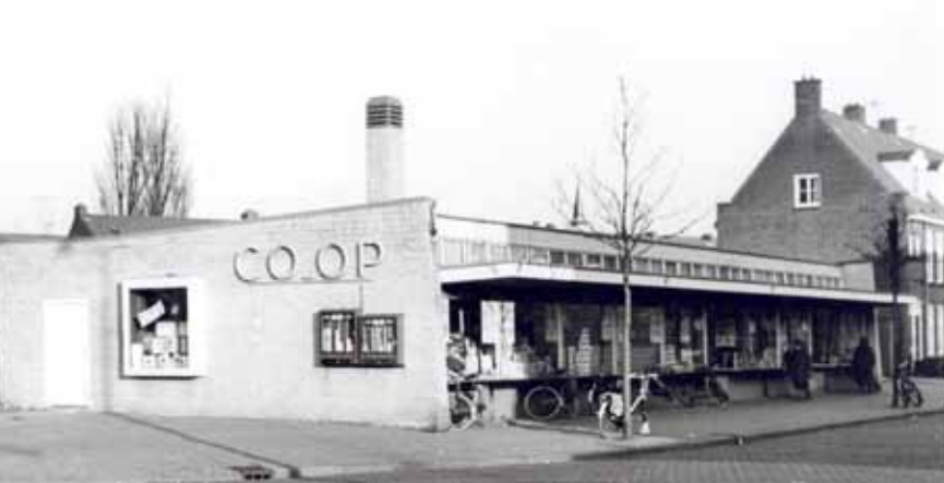
De Coöp supermarkt aan de Linnaeusstraat in 1964.

P. Feddema op nummer 36 en steenhouwerij Arends op nummer 196. Aan de Bleeklaan kwam een behoorlijk aantal kleinere bedrijven, zoals smederij Van Eldik (nummer 21), grossierderij Faber (23), verhuisbedrijf Postma (25), postorderbedrijf Mercurius (27), ijsfabriek Van den Akker (29), Philipp's Parfumeriefabriek (31) en haringinleggerij Nieuwland (33).