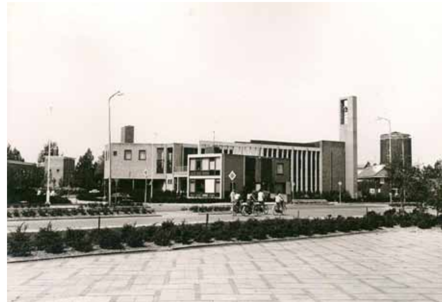
De Salvatorkerk in 1968.

die toegangsweg onbegaanbaar. Dit was reden genoeg voor de gemeente om het Kalverdijkje van klinkers te voorzien, vanaf de Groningerstraatweg tot aan het Schoppershof, met een zijtak naar de schietbaan. In 1873 werd de baan (250 meter bij 18 meter) in gebruik genomen. Op het terrein bij de schietbaan werd een kruithuis gebouwd, ter vervanging van het oude kruithuisje bij de verswatervijver bij de Oostersingel. Vanaf 1907 kregen ook “gewone” burgers de mogelijkheid lid te worden van de schietverenigingen ter plaatse. De gemeentelijke schietbaan werd verhuurd aan het Rijk. In 1930 besloot de gemeente die huur op te zeggen gezien de oprukkende bebouwing aan de oostkant van de stad. Als herinnering is de zogenaamde “schietbaanboom” jarenlang gespaard, een knoestige wilg en de oudste en dikste boom van het Zamenhofpark. Eind jaren dertig zou een nieuwe baan gerealiseerd worden, meer oostelijk gelegen aan het Kalverdijkje, achter de molen; een terrein dat vroeger nog als vliegveldje is gebruikt.