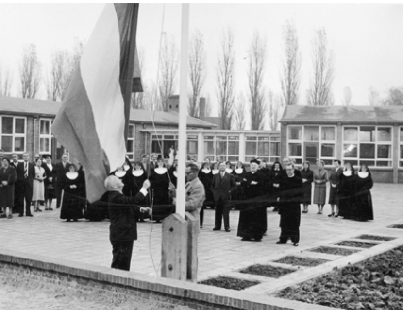
De opening van de St. Joseph-school op 9 november 1955.

In 1955 werd aan de zuidkant van het Oosterpark de rooms-katholieke kleuterschool St. Joseph ingezegend en geopend. Deze school was ontworpen door architect Arjen Witteveen. Het gebouw had drie lokalen op het zuiden, haaks op de Frederik Ruyschstraat, en