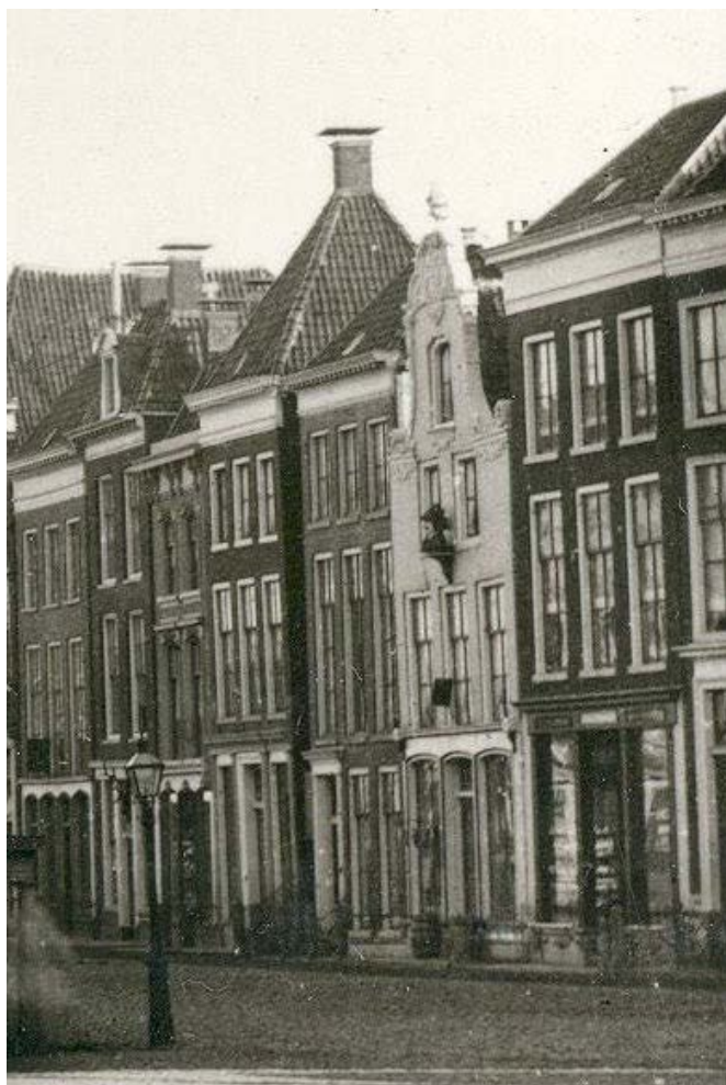
11 De gaper van Warmoesstraat 160 op zijn nieuwe plaats: Nieuwestad 156, Leeuwarden. foto waarschijnlijk vóór of rond 1871 (detail).