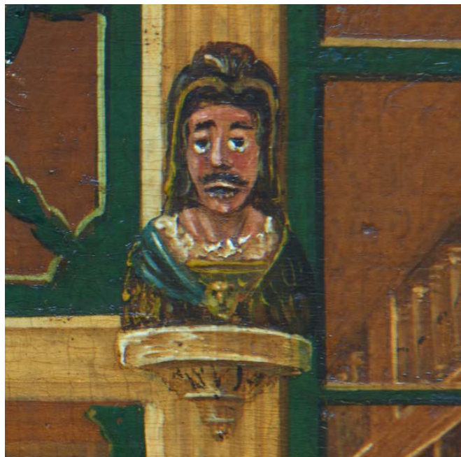
10 Detail van Hendrik Muller jr., Apotheek in de Warmoesstraat bij de Vischsteeg te Amsterdam, 1824 . Olieverf op paneel, 26 x 33 cm. Particuliere collectie, Den Haag.

form zich momenteel in het Historisch Centrum Leeuwarden bevindt (afb. 1). Dit exemplaar hing vanaf 1824 of eerder uit bij Warmoesstraat 160 in Amsterdam en verhuisde later naar Nieuwestad 156 in Leeuwarden.