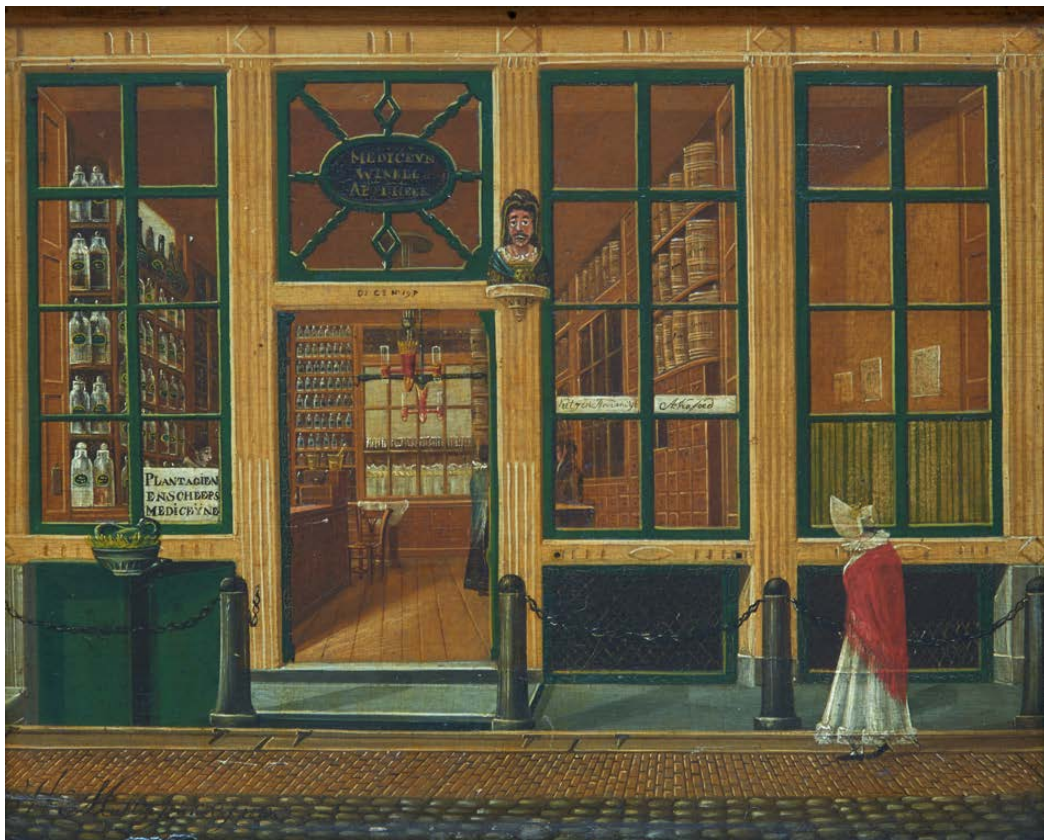
9 Hendrik Muller jr., Apotheek in de Warmoesstraat bij de Vischsteeg te Amsterdam, 1824 . Olieverf op paneel, 26 x 33 cm. Particuliere collectie, Den Haag.