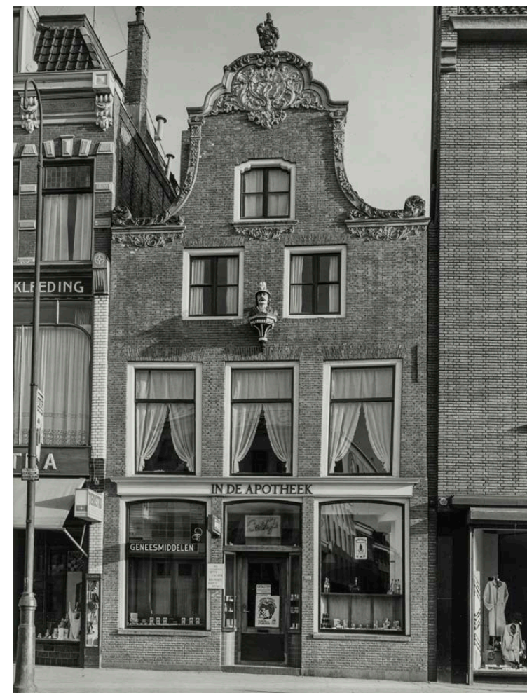
12 De gaper van Warmoesstraat 160 aan de gevel van Nieuwestad 156 te Leeuwarden.