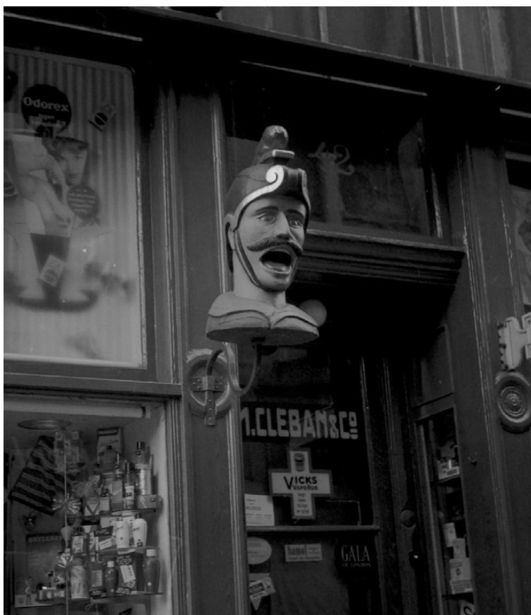
3 De gaper van drogisterij M. Cléban & Co., Heiligeweerde. Foto H.W. Alin, circa 1962, Stadsarchief