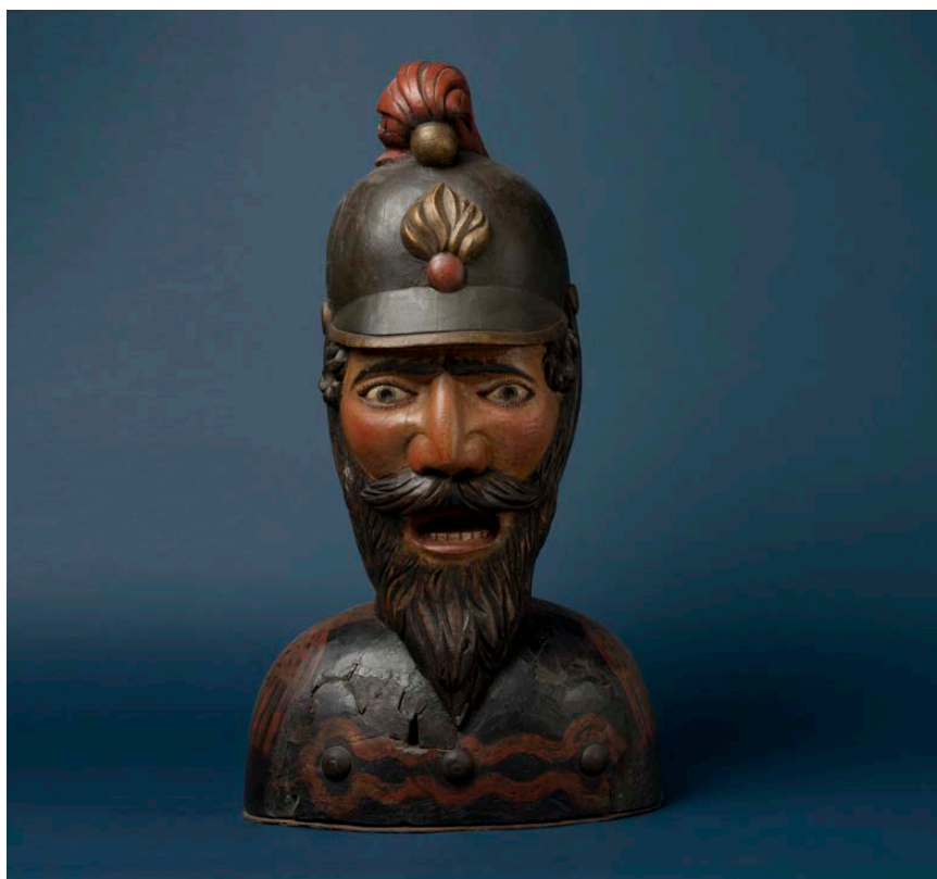
7 De gaper van de drogisterij van H. Loggen, Haarlemmerdijk 174, Zuiderzeemuseum (in bruikleen).