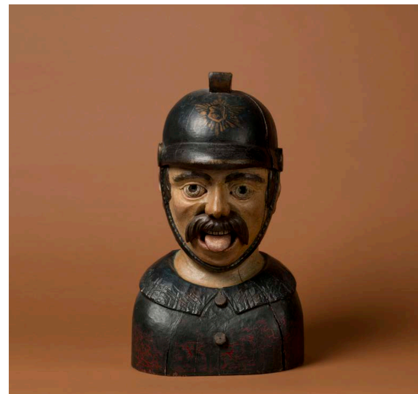
8 Brandweerman, mogelijk afkomstig uit Amsterdam, Zuiderzeemuseum (in bruikleen).

Een vierde gaper in uniform sierde vanaf omstreeks 1860 de winkelpui van Johannes Hunsche op de Oudeschans, nadat hij eerder twintig jaar dienst had gedaan in de Koningsstraat (afb. 5 en 6). Toen er in 1895 brand uitbrak in het pakhuis waar de winkel van Hunsche was gevestigd, was ook deze gaper bijna in vlammen opgegaan. Gelukkig wist de brandweer de schade te beperken tot de bovenverdieping. 22 In 1928 werd het pand, inclusief gaper, opgenomen in de Voorloopige lijst der Nederlandsche monumenten , maar toch werd de gaper rond 1936 van de muur gehaald en binnengezet bij een familielid van de drogist. 23 Pas