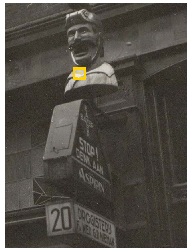
4 De gaper van drogisterij Fa. wed. G.D. Nieman, Gravenstraat 20. Foto Thijs Mol, circa 1940, Stadsarchief Amsterdam (detail).

DE GAPER IN UNIFORM In de loop van de tijd ontwikkelde de gaper zich en ontstonden er verschillende typen. Hoewel elke gaper uniek is, laten de meeste exemplaren zich indelen in een van vier categorieën, namelijk (1) oosterling, (2) gaper in uniform, (3) apotheker en (4) nar. Voor het ontstaan van deze typen zijn in het verleden verschillende verklaringen voorgesteld, die merendeels ontleend werden aan het standaardwerk De uithangteekens, in verband met geschiedenis en volksleven beschouwd uit 1868 van Jacob van Lennep en Jan ter Gouw. 6 De veelheid aan verklaringen voor de gaper die in dit boek worden voorgesteld laat zien dat de precieze ontstaansgeschiedenis van het uithangteken midden negentiende eeuw al niet meer algemeen bekend was.