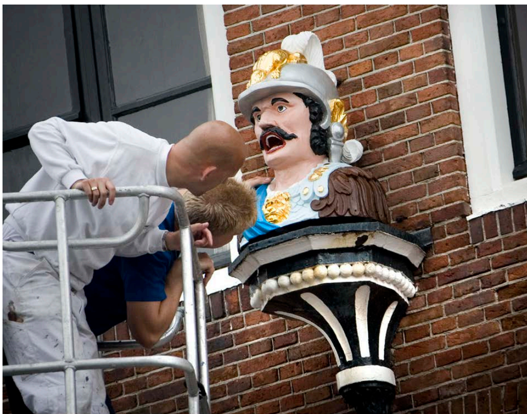
13 Het plaatsen van de replica van de gaper van Warmoesstraat 160 aan de gevel van Nieuwestad 156

in Leeuwarden, 16 juli 2007.