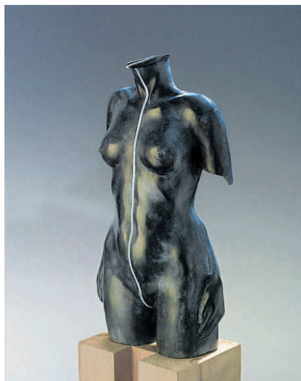
The thin light line.

Leeuwarden - Pier Pander Museum (onderdeel van HCL, Groeneweg 1): za en zo 13-17 u, t/m eind sept, www.historischcentrum-leeuwarden.nl