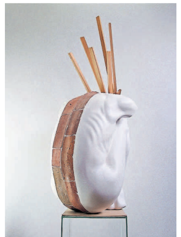
Spare in trouble, strange in fright.