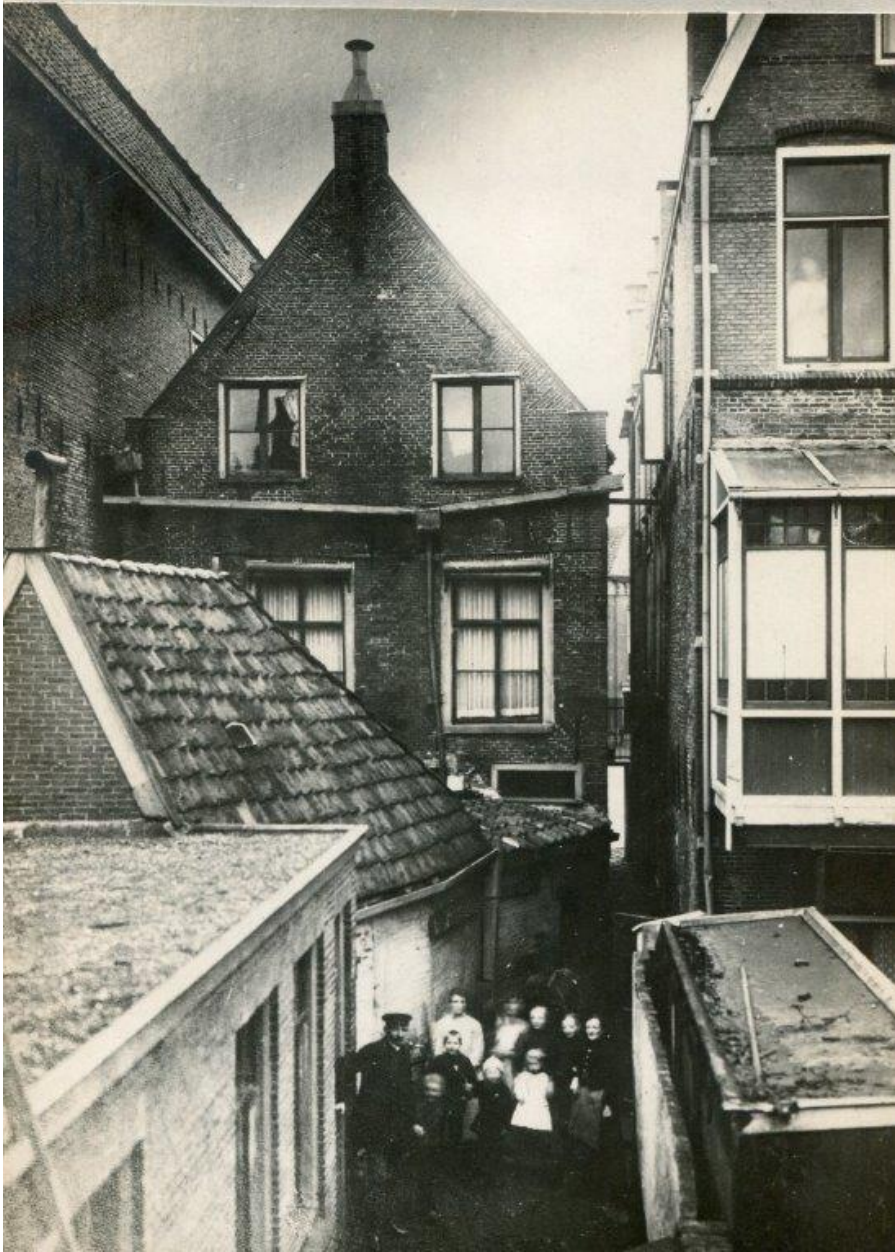
De achterzijde van Het Gouden Wagentje, rond 1910 gezien vanuit de oostelijk belendende steeg. De personen op de foto zijn onbekend, doch zouden leden van de familie Brada kunnen zijn.