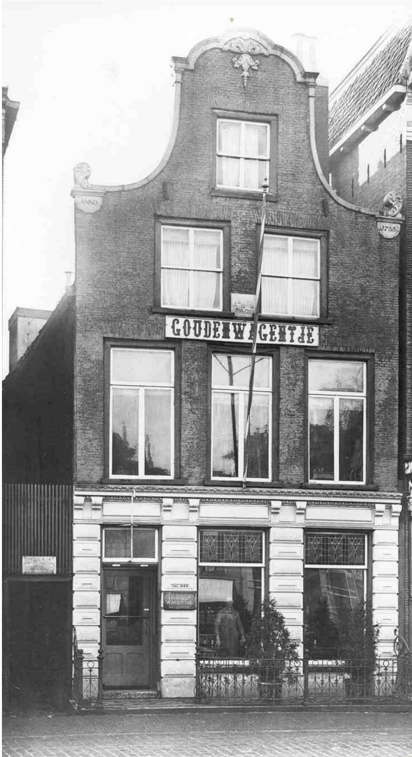
Het pand Nieuwestad zuidzijde nr. 124. Koffiehuis "Het Gouden Wagentje" rond 1912.