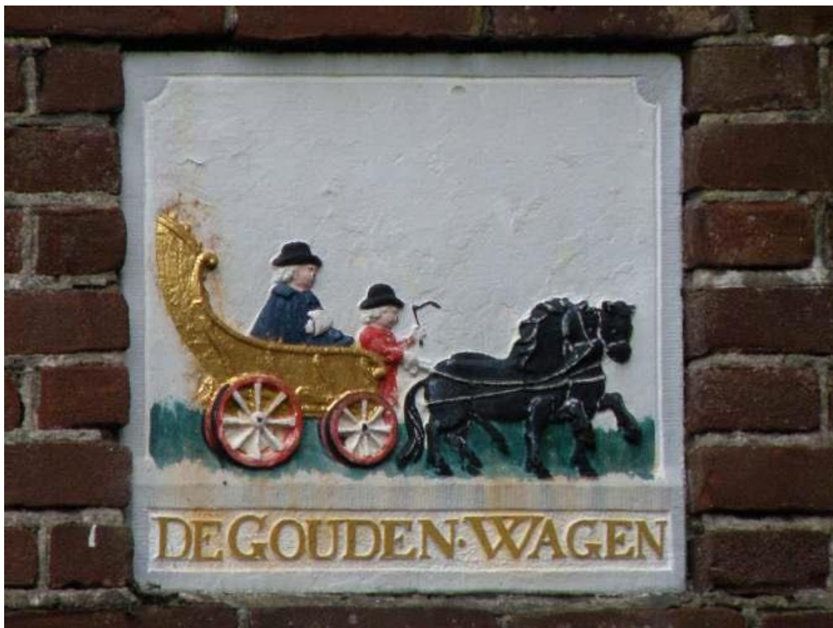
De gevelsteen van Het Gouden Wagentje in de Pijlsteeg.