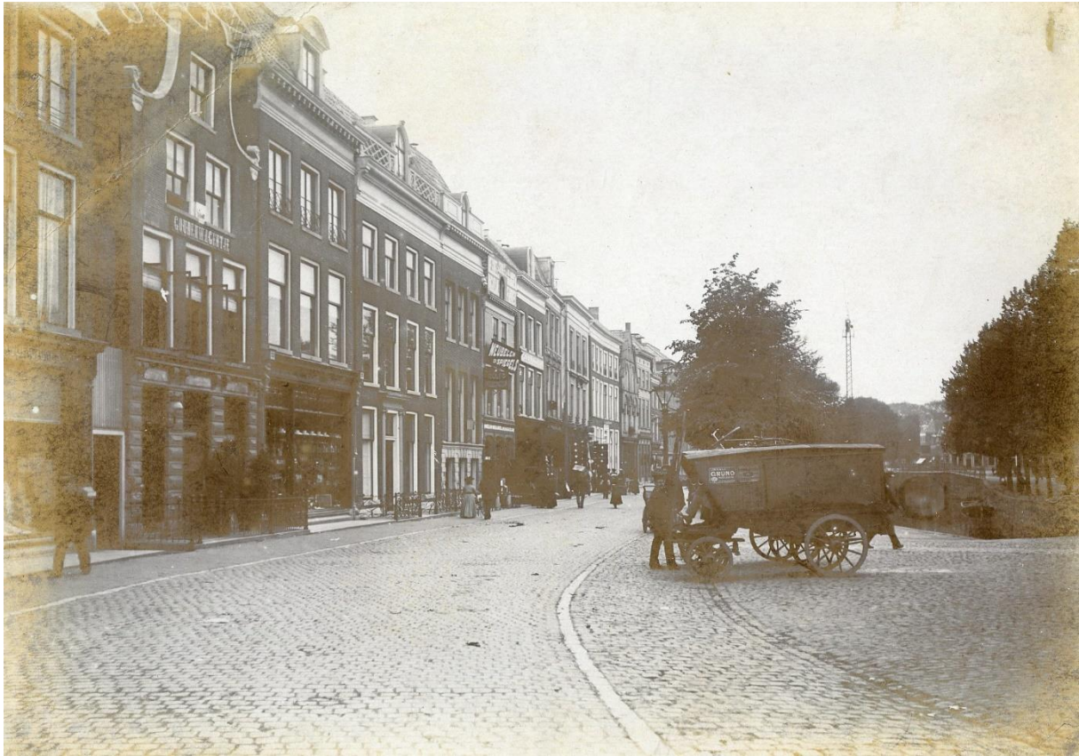
Het Gouden Wagentje aan de Nieuwestad op een foto uit 1905. Het paard van waarschijnlijk de uitgespannen postkoets op Groningen lijkt ter verzorging door de steeg naar de stalling achter de herberg te zijn gebracht.