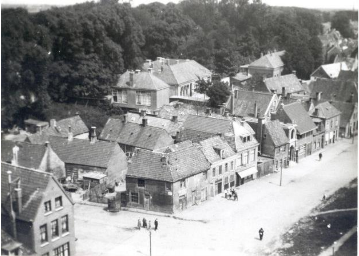
Panoramafoto van de Boterhoek, in de jaren '20 genomen vanaf de Oldehove. In het midden de voormalige B.L.O.-school

Reeds kort na de oprichting van de school werd zij gesplitst in twee afdelingen: één voor 'debielen' en één voor 'imbecielen'. In 1931 onderging de B.L.O.-school een forse uitbreiding aan de west- en zuidzijde, waarna de school tevens een meer professionele ruimte bood aan de crèche van de 'Vereeniging Kinderbewaarpplaats' die reeds in november 1927 haar intrek had genomen in twee voor dat doel ontruimde lokalen van het oude gebouw. Nadat de school in het voorjaar van 1945 korte tijd dienst had gedaan als Gemeentelijk Evacuatieziekenhuis, ontstonden in 1957 de namen Prinsentuinschool I en II. In 1960 verhuisden de leerlingen van Prinsentuinschool II naar een nieuw gebouw aan het Schapendijkje en niet lang daarna die van Prinsentuinschool I naar de Arendstuinschool.