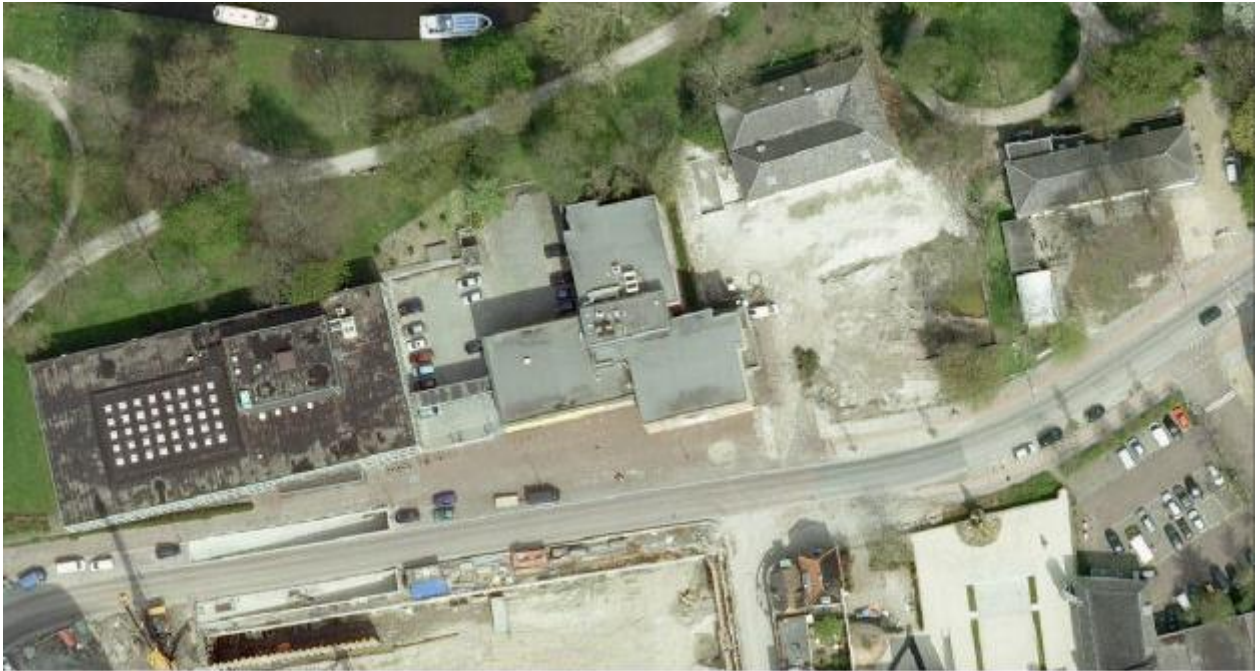
Luchtfoto van de nieuwbouwlocatie en naaste omgeving, zomer 2006. Rechts van het voormalige Ryksargyfgebouw het bouwterrein van het toekomstige HCL met het als informatiecentrum in te richten oude schoolgebouw

Het jaar daarop kon worden begonnen met het bouwrijp maken van het voorterrein ten behoeve van het uitgraven van de ondergrondse archief-depots. Dit terrein maakte oorspronkelijk deel uit van de tuin van de voormalige Stads Schuttersdoelen op de hoek van het Tournooiveld en het voormalige Sint Jobsleen.