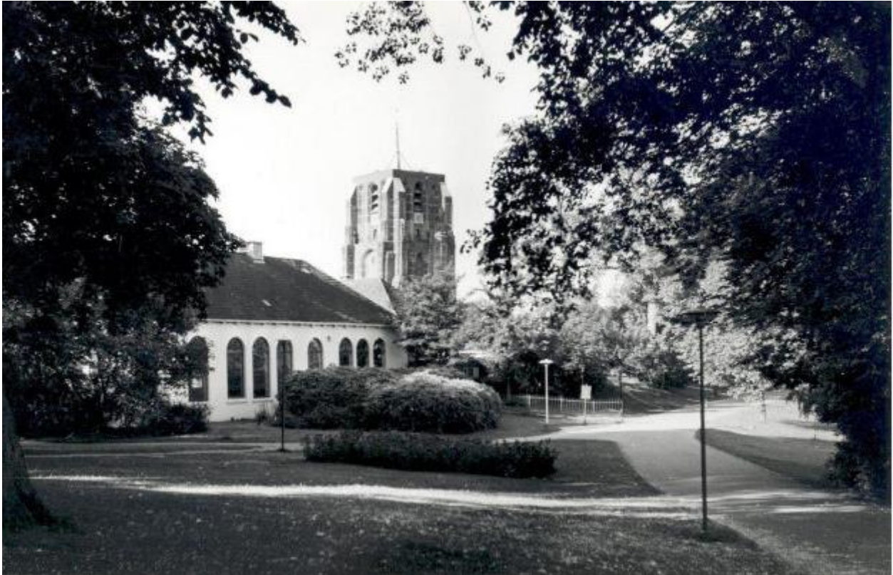
Gezicht op het R.O.N.O.-gebouw vanuit het noordoosten in de zestiger jaren van de vorige eeuw

In 1968 kreeg de studio meer ruimte en outillage. In 1975 heette de RONO-studio na een ingrijpende verbouwing de best geoutilleerde regionale studio van het land te zijn. Op 21 november 1977 schalde voor het eerst de naam 'Radio Fryslân' door de ether. Grote waardering verwierf Radio Fryslân met zijn zeer uitgebreide uitzendingen in de dagen na de beruchte sneeuwstorm medio februari 1979. In 1988 veranderde de naam Radio Fryslân in Omrop Fryslân. Naast radio werd er nu ook televisie gemaakt. In 1999 verhuisde de Omrop naar een nieuw gebouw aan de Zuiderkruisweg. Enige jaren van leegstand braken nu aan.