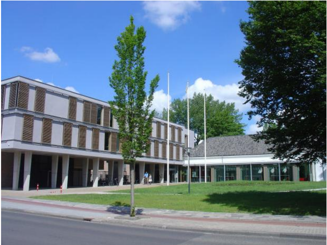
Exterieur Historisch Centrum Leeuwarden in 2011

In 2007 is het Historisch Centrum Leeuwarden voor de tweede maal in zijn bijna 170-jarige bestaan naar een andere plek verhuisd. Een plek die kan bogen op een bewogen geschiedenis van ruim vijf eeuwen. Het HCL is ondergebracht in het oudste schoolgebouw van de stad, dat is gesitueerd op een van de mooiste locaties in de oude binnenstad.