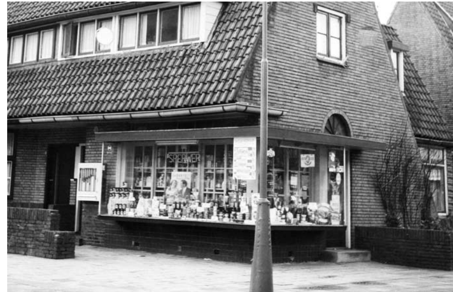
De winkel van J. Wollenstein voerde het merk Sperwer en deed in kruidenierswaren. De foto van 1955 laat de hoek zien van de Achlumerstraat en de Sexbierumerstraat.

Pal hierachter doemt een interessant gebouw op. Het is de door architect J. Zuidema in Amsterdamse Schoolstijl ontworpen "Vosseburcht", een openbare lagere school. In december 1929 was dit de nieuwe gemeenteschool nummer 16. Na de Tweede Wereldoorlog kreeg de school de naam van de straat: Coornhertschool en in onze tijd (1992) werd een fusie met de Leeuwerikschool doorgevoerd en werd het de Vosseburcht. Hoewel de naam niets met de naam van de wijk van doen heeft, is het toch een aardige vondst: de plaats waar de jonge vosjes (jonge Vosseparkwijkbewoners) worden grootgebracht!