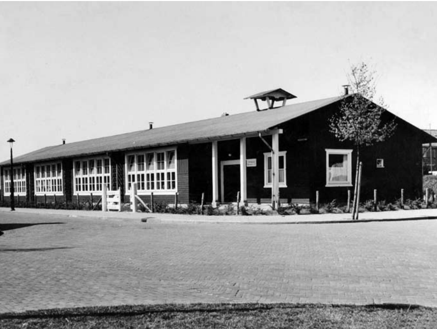
De gemeentelijke kleuter- en lagere school, het Roodborstje, aan de Brederostraat. Een foto uit begin jaren vijftig.