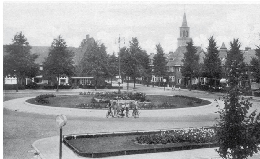
Het 'Engelscheplein' van vlak voor de oorlog. We kijken rechtsvoor de Engelsestraat in met als blikvanger van de wijk, de Dominicuskerk.

Aan het eind van die straat bereiken we de Vondelstraat. Keken we vroeger op deze plek aan tegen de enorme Hogere Technische School,