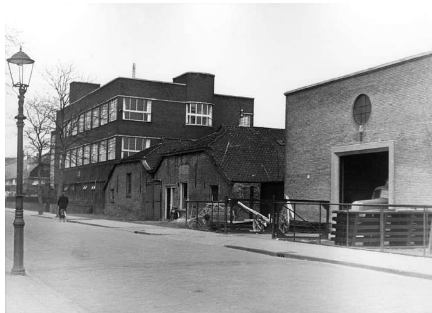
De Molenstraat in 1953, vlak voor de afbraak van de brandstoffenhandel die in die oude loodsen zat. Rechts is een gebouw van De Noordkant, later CAF, te zien. De MTS bepaalt hier het straatgezicht.

We steken nu scheef over richting het Vossepark en passeren een dubbele, rietgedekte dubbele villa van de hand van G.A. Heldoorn. Hierachter staan nog meer villa's in het park. Dit clustertje woningen staat op de plaats waar eens de broodfabriek "De Hoop" stond. De tuinen werden geraffineerd aan het Vosseparkje gekoppeld zodat het een geheel lijkt. We stappen hier het Vossepark voor het eerst binnen. Volg het pad naar rechts. Let op de fraaie aanleg. Zowel de hoogtes als de grillige oevers en paden verraden de Engelse landschapstuin. Tuinarchitect Vlaskamp nam de ideeën hiervoor over van de beroemde Roodbaard. Maak het u zich hier gemakkelijk want de banken staan ter beschikking van de vermoeide wandelaar. In het park staan veertien monumentale bomen. We volgen het buitenpad en zien eerst een Robinia, dan de Blauwe Atlasceder en vervolgens een Ginkgo. Na