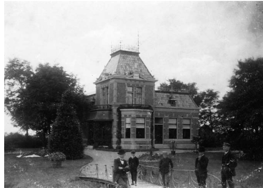
De villa 'Baens Ein' stond aan de Marssumerdijk en markeerde het eind van de harddraversbaan. Hier een foto uit circa 1900.