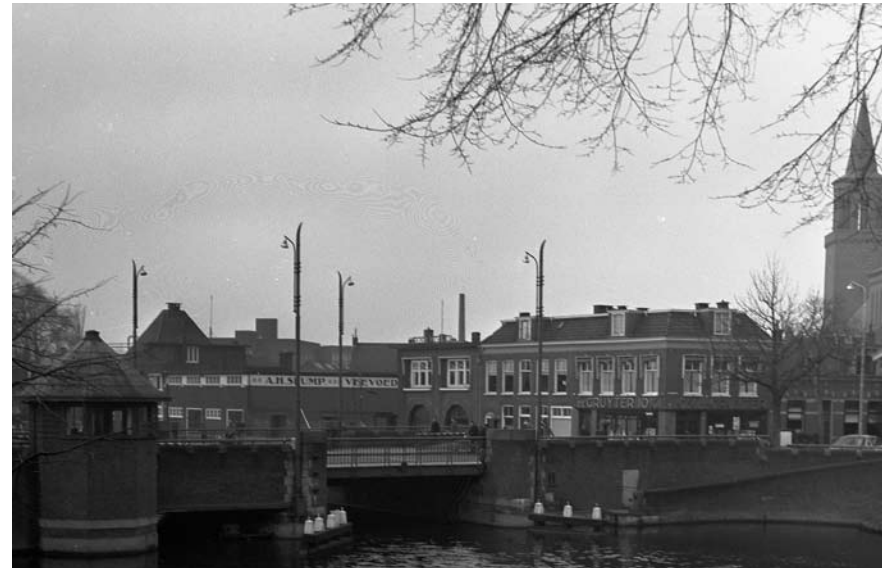
Een blik op de oostelijke hoek van de Vosseparkwijk, net buiten de Vrouwenpoortbrug. Deze foto laat een van de laatste De Gruyterwinkels zien (met het snoepje van de week) aan de Westersingel. Dominant is natuurlijk de Dominicuskerk.

De Vrouwenpoortbrug dankt zijn naam aan de buitenpoort van het Middeleeuwse Leeuwarden die elke avond werd afgesloten om de volgende morgen weer toegang te geven tot de stad. Het was een poort over het water. Bij de ingang van de tegenwoordige Nieuwestad stond trouwens een binnenpoort. Een dubbel controlepunt. Wie te laat bij de poort was, kwam er niet meer in en was gedwongen of de nacht buiten door te brengen of een kamer te nemen in de nabijgelegen herberg (nu de fietsenwinkel aan de Westersingel).