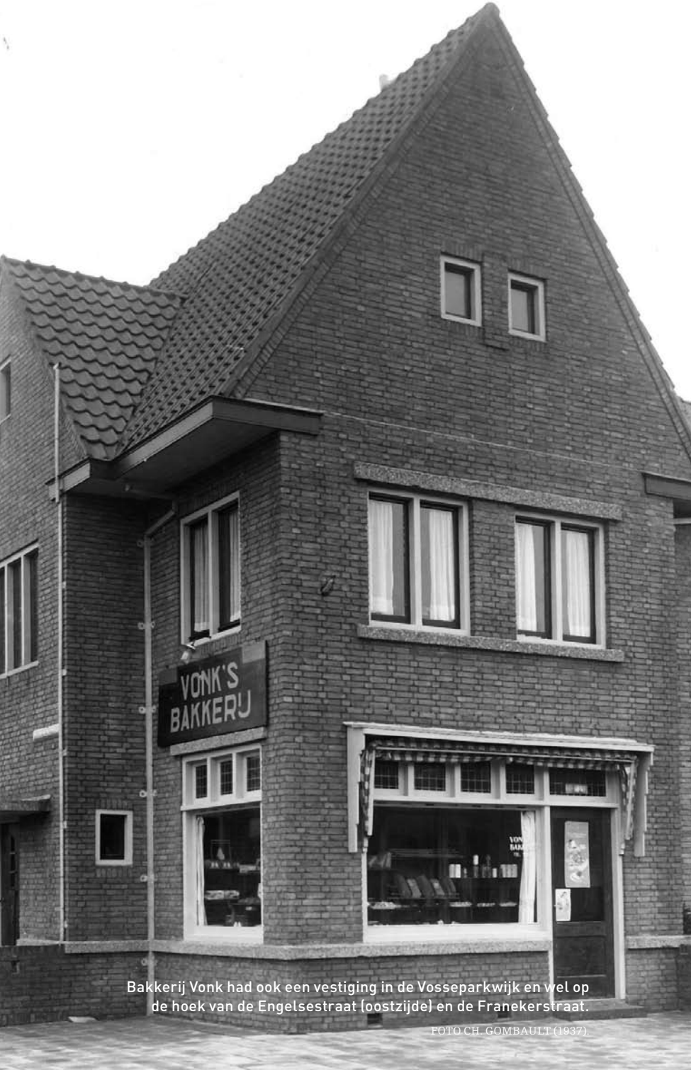
Bakkerij Vonk had ook een vestiging in de Vosseparkwijk en wel op de hoek van de Engelsestraat (oostzijde) en de Franekerstraat.