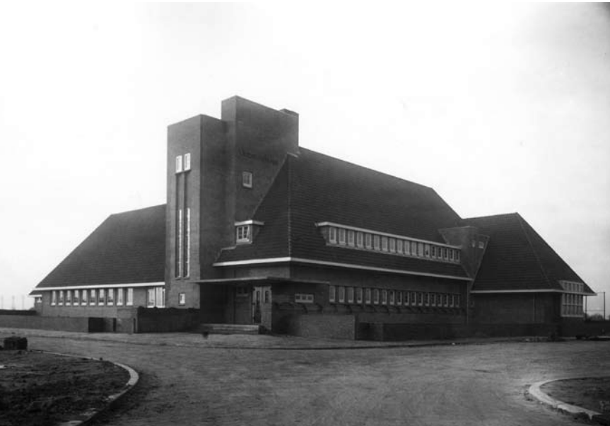
De fraaie Gemeenteschool 16 in Amsterdamse Schoolstijl in wat toen nog (1929) de Molenstraat was. Tegenwoordig staat de Vosseburcht aan de Coornhertstraat.

Van de Rhijnvis Feithstraat gaat het linksaf de Heliconweg op en dan doorlopen tot de eerste zijstraat links, de Achlumerstraat. Voordat we de straat ingaan, moet de wandelaar even over de rondweg heen kijken. Daar ligt het enorme complex van het WTC (World Trade Centre) EXPO, vooral expositiehallen voor (internationale) tentoonstellingen en publieksevenementen. Op dezelfde plaats stond eerder de Frieslandhal (vertrekpunt van Elfstedentochten), die afbrandde. We zien rechts van de hallen ook nog de ijsbaan staan. En dat alles omringd door enorme parkeerterreinen die tot de Slauerhoffweg, nu de ontsluitingsweg, doorlopen. Maar de wandeling gaat verder de woonwijk weer in. De Achlumerstraat heeft de typerende woningen die zo kenmerkend zijn voor de Vosseparkwijk. De straat werd in 1929 aangelegd en bebouwd. Halverwege de straat strekt zich rechts het grondgebied van de speeltuinvereniging De Toekomst uit. Het is de grootste en mooiste speeltuin van de stad met een verenigingsgebouw aan de straat.