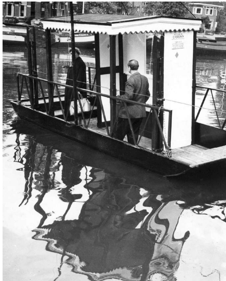
De bewoners van de Vosseparkwijk hebben jarenlang plezier gehad van het pontje over de Westersingel ter hoogte van de Harmonie. Het bootje werd aan een kabel met handkracht overgetrokken. De pontbaas vroeg twee cent voor elke overtocht. Kwam er een schip voorbij dan moest de kabel los om neergelaten te worden. De foto is uit 1955.