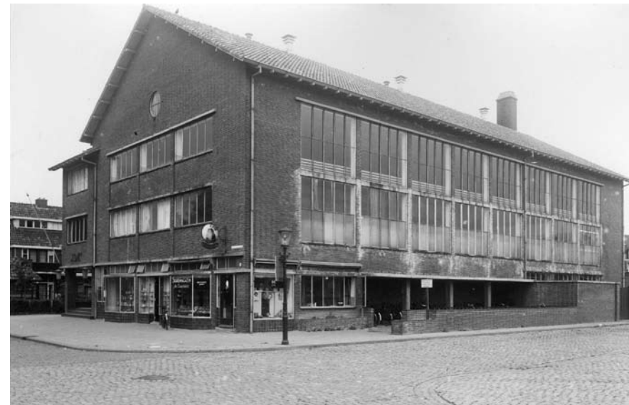
Aan het Jacob Catsplein stond de Overdekte, de Leeuwarder Overdekte Zweminrichting, waar generaties Leeuwarders hun zwemdiploma haalden en de zwemclub LZO triomfen vierde. Deze foto laat een curieuze winkel zien. In de hoek naast de fietsenstalling zit een sigarenzaak!

Daarna kwam er een ongekennde ontwikkeling op gang waarvan het resultaat voor uw neus staat. De veemarkt aan de Lange Markstraat werd verplaatst naar de Frieslandhal (klaar in 1963) en kwam daarmee te liggen in de Vosseparkwijk! De industriële gebouwen langs de Harlingertrekweg verdwenen. Een geheel nieuwe bedrijfstak kwam hier tot ontwikkeling: de zakelijke dienstverlening, inmiddels de grootste werkgever van Leeuwarden. Hier kwam als eerste het Belastingkantoor gereed, begin jaren zeventig. Op het punt waar u staat zijn alle belangrijke kantoorgebouwen te zien. U staat voor het complex van ING, de voormalige Postbank. Als eerste kwam hier de