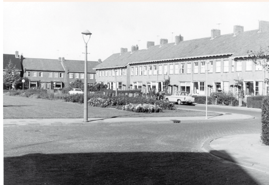
Een deel van de Vosseparkwijk ligt aan de andere kant van de rondweg. De straten rondom het parkje aan de Betje Wolffstraat en de Aagje Dekenstraat hebben een keur aan fraaie woonhuizen.

Wie de tijd heeft steke hier het zebrapad over om een jongere woonkern van de Vosseparkwijk te bekijken. Het gaat om ruime straten en een weids plantsoen. De straten dragen de namen van schrijvers (schrijfsters) uit de negentiende eeuw: Aagje Deken en Betje Wolff bijvoorbeeld, maar ook Potgieter en Nicolaas Beets zijn hier vernoemd. De uiterste westgrens vormt de Bilderdijkstraat. Hier staan een aantal aantrekkelijke vrijstaande villa's die hun achtertuin vroeger zagen eindigen tegen de spoorlijn van het "Dokkumer Lokaaltsje", de tramweg naar Dokkum. De spoorbaan is weggehaald maar hier ligt wel de westelijke grens van de Vosseparkwijk. Nu terug naar het punt waar we waren aan de Heliconweg.