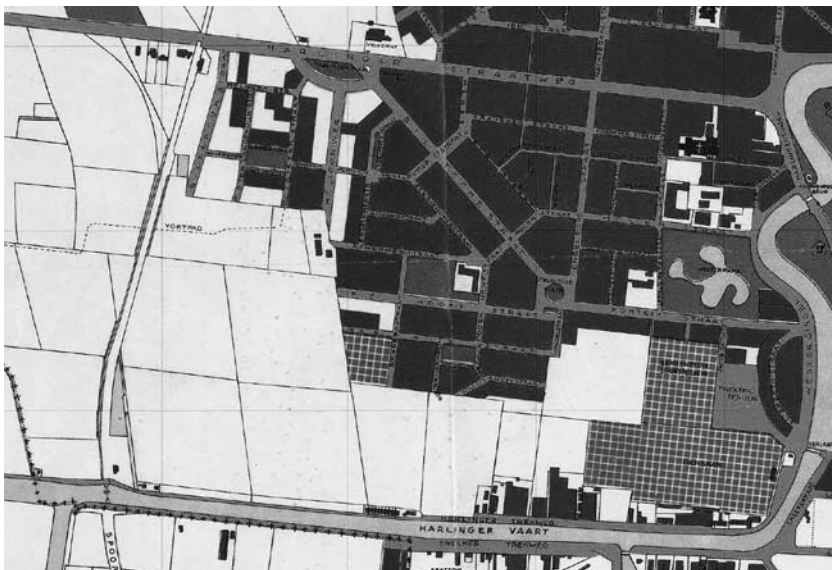
Een plattegrond van de Vosseparkwijk uit 1943. Let op de verschillen met de wandelroute van de wijk.

van deze westelijke woonwijk. Er staat in de nabije toekomst weer veel op stapel. Langs beide zijden van de Tesselschadestraat verrijen de komende jaren nieuwe woongebieden. Als de bouwers hier even zorgvuldig te werk gaan als hun voorgangers uit de vorige eeuw, dan zal dat in de toekomst een nieuwe wandeling door de Vosseparkwijk rechtvaardigen.