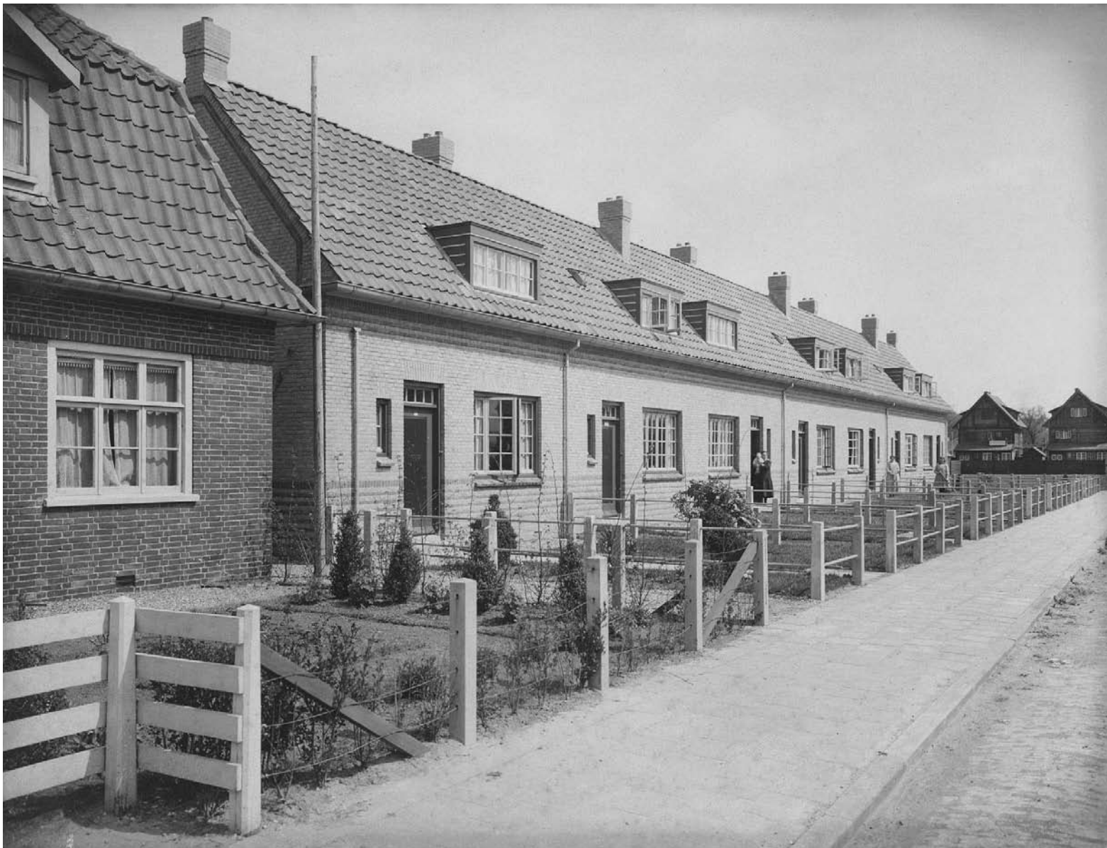
Gemeentewoningen uit 1921 aan de Franekerstraat vlak na de oplevering. Een rijtje koopwoningen moet nog worden gebouwd, zodat wij hier kunnen kijken tot de achterkanten van de houten huizen aan de Engelsestraat. Foto uit 1921.