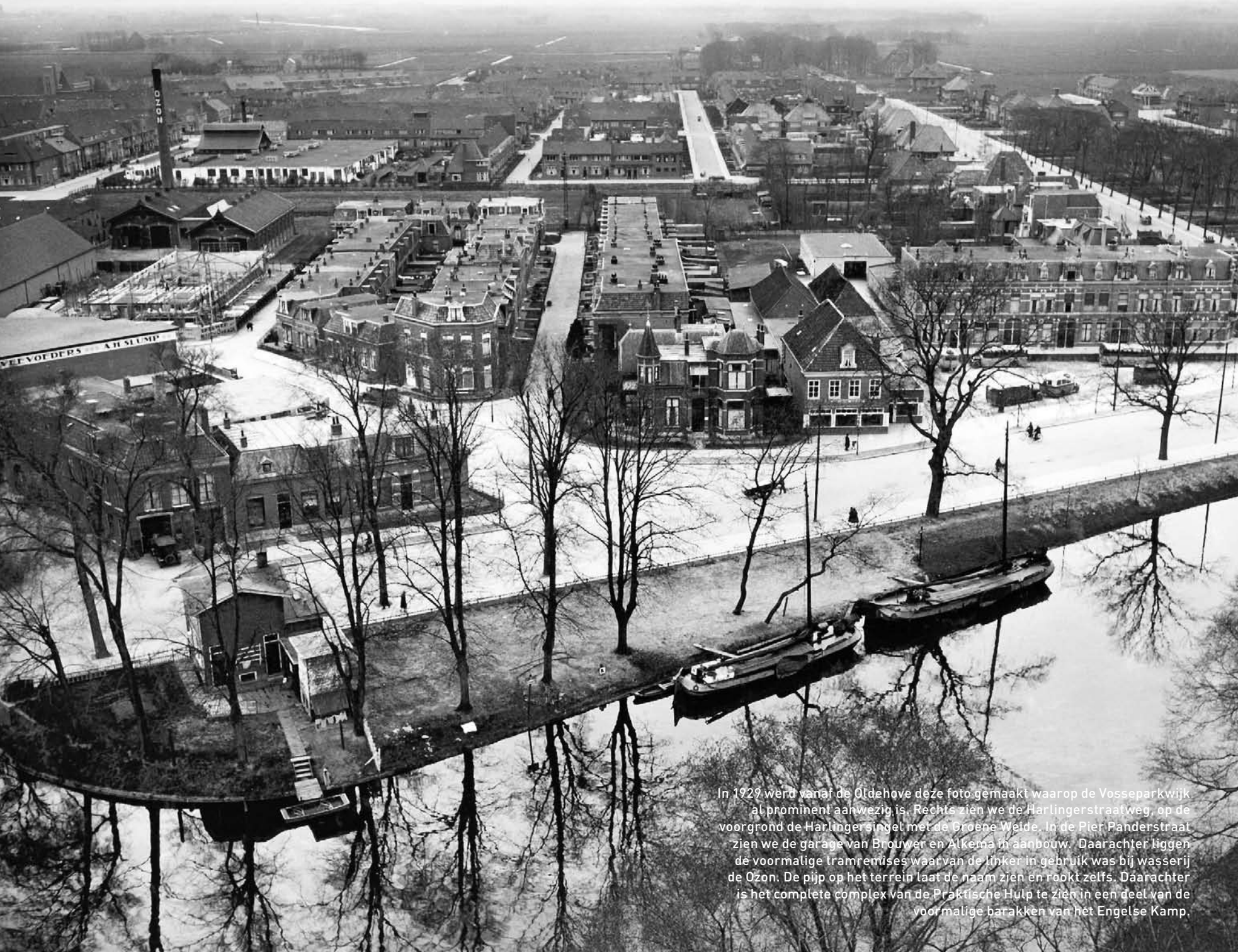
In 1929 werd vanaf de Oudehove deze foto gemaakt waarop de Vosseparkwijk al prominent aanwezig is. Rechts zien we de Harlingerstraatweg, op de voorgrond de Harlingersingel met de Groene Weide. In de Pier Panderstraat zien we de garage van Brouwer en Alkema in aanbouw. Daarachter liggen de voormalige tramremises waarvan de linker in gebruik was bij wasserij de Ozon. De pijp op het terrein laat de naam zien en rookt zelfs. Daarachter is het complete complex van de Praktische Hulp te zien in een deel van de voormalige barakken van het Engelse Kamp.