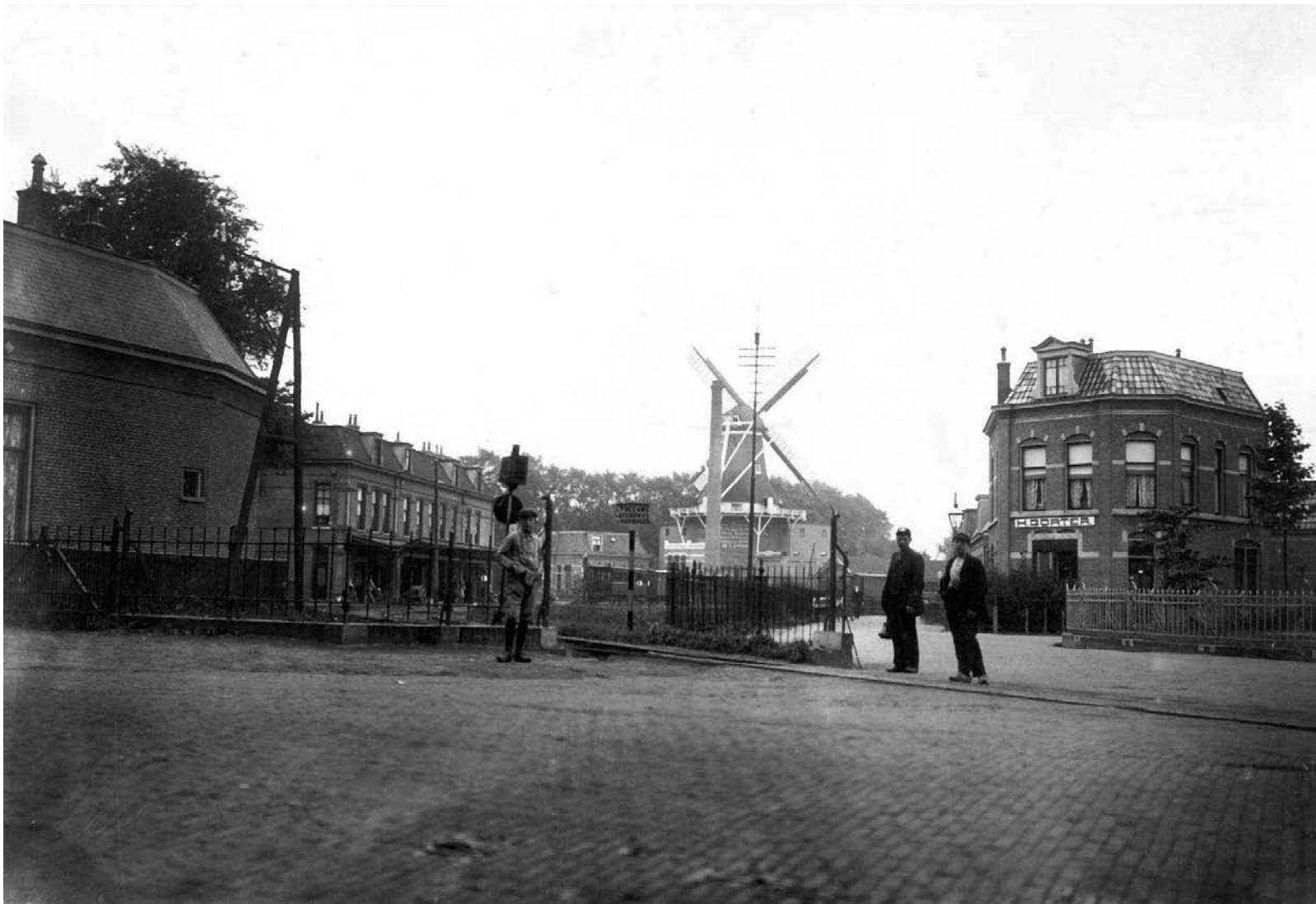
Een van de drukste punten van Leeuwarden was begin twintigste eeuw en nu nog, de kruising van de Harlingersingel en wat nu de Pier Panderstraat is. Hier kruiste het verkeer van en naar de binnenstad de belangrijke tramweg naar het noorden van de provincie. Links het tramstation, het afgezette terrein rond de rails en in de verte de molen Het Lam aan de Molenstraat.