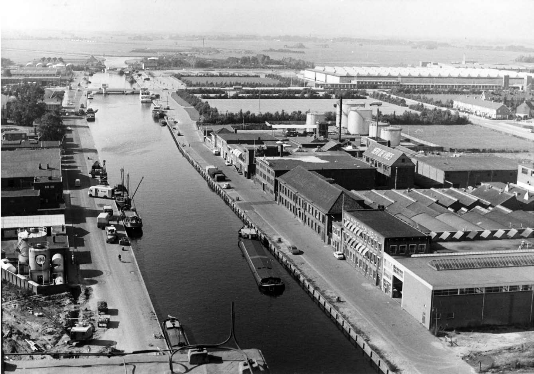
Een magnifieke foto op het moment dat alle bebouwing aan de Harlingertrekweg er nog staat en de nieuwe Frieslandhal op de achtergrond al zichtbaar is.