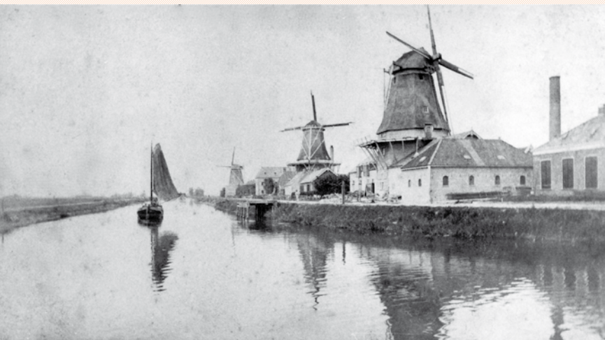
In 1884 zag het begin van de Harlingertrekweg er zo uit: De molens waren de voorlopers van de industriële ontwikkeling. Van links naar rechts De Kat, De Fortuin en De Jonge. Op deze plaats staan nu de gebouwen van de ING.

Wie de grenzen van de Vosseparkwijk eens wil opzoeken, moet hier het kruispunt oversteken en (recht) doorlopen naar de Harlingertrekweg en het water. Niet alleen de boten die hier liggen zijn de moeite van het bekijken waard maar hier zien we ook uitgebreide nieuwbouw: de GG&GD staat hier en het kantorencomplex van UPC; de witte gebouwen zijn vooral in gebruik bij zorgverzekeraar De Friesland. Op deze plaats lag tot in de negentiende eeuw de 'galgefenne', de plek waar ter dood veroordeelden werden opgehangen. Niet vaak meer gehoord maar in de volkswijsheid heten de Leeuwarders "galgelappers" (hoewel de galg voor heel Friesland dienst deed waren het alleen de Leeuwarders die meebetaalden oftewel moesten 'lappen'). Langs de Harlingertrekweg is de industrialisatie van de Friese hoofdstad begonnen. Hier stonden eens drie molens en bedrijven als Benninga (Bebogeen), Fortuna (meel), Hero de Vries (meubels), machinefabriek Jongia en Shell (olieopslag). Het laatst verdween hier de Leeuwarder Papierwaren Fabriek, LPF.